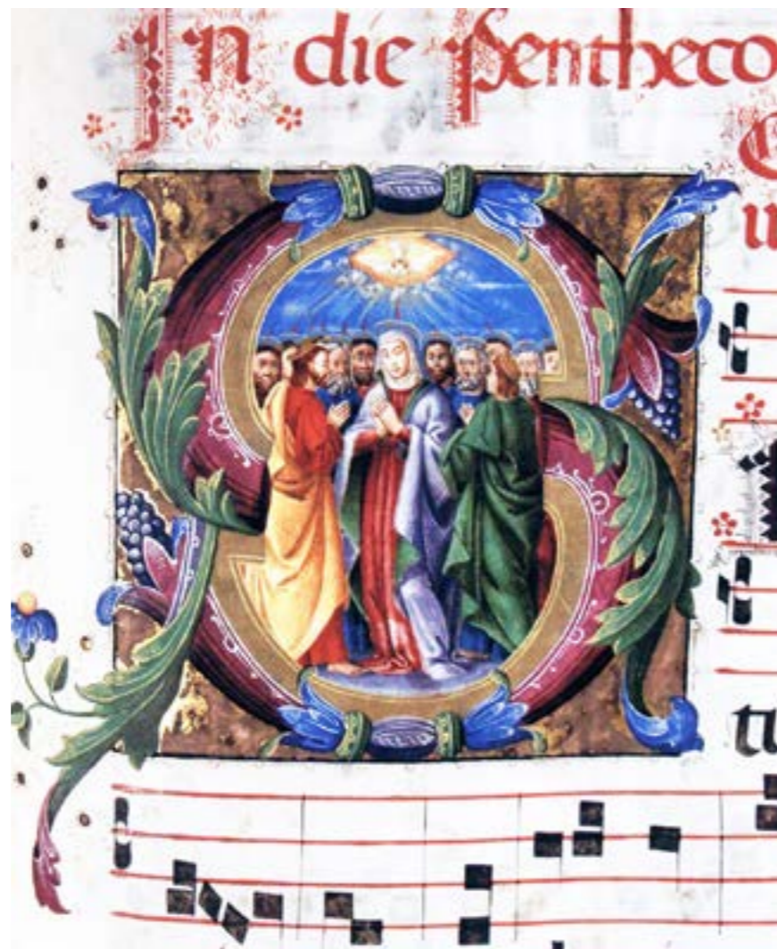
Figura 5: Pentecostes - Liber Missarum de Tempore ab Adventu usque ad Cenam Domini . Fonte: Biblioteca Estatal de Lucca. Ms. 2649 Imagem em domínio público - Detalhe editado por Walter Miranda

se como profissional cuja fama espalhou-se por toda a Itália e além, provocando a inveja danosa de um artista concorrente. Era extremamente respeitada na cidade de Bolonha e recebia com frequência a visita de viajantes estrangeiros a mando de reis e nobres de outras regiões, que buscavam notícias dela. O próprio papa Clemente VII (1478-1534) planejou visitá-la, mas ela morreu uma semana antes da viagem dele. Sua morte causou enorme tristeza e