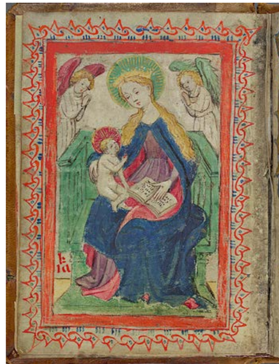
Figura 3: Madona e criança . Fonte: Biblioteca Real de Estocolmo. Ms. A43. Imagem em domínio público - editada por Walter Miranda

em Gent ( Museum Voor Schone Kunsten Gent ), também seja de sua autoria 19 .