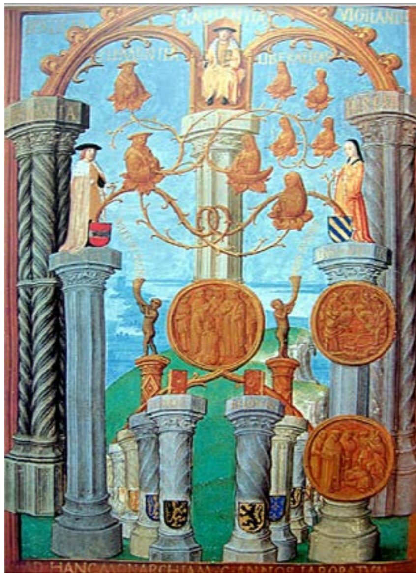
Figura 2: Apoteose de Carlos V.