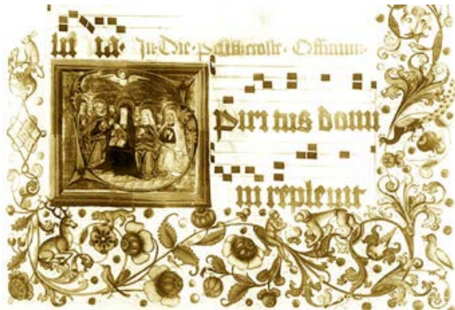
Figura 7: Gradual de Medingen. Clm 23014 fol. 235.