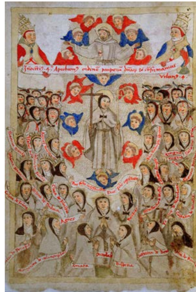
Figura 8: Visão de Santa Clara e São Francisco . Fonte: Volterra, Biblioteca Guarnacci Ms. 4146 folio 4v. Imagem em domínio público - editada por Walter Miranda

Meu relato sobre as artistas ativas durante este período histórico, que denomino de Intermezzo , continuará em meu próximo texto, mas cabe ressaltar que, embora os livros de história da arte não atestem este fato, a atividade das artistas mulheres extrapolou a criação de manuscritos e exerceu forte influência no trabalho dos artistas masculinos contemporâneos delas, mas isso é material para uma futura pesquisa.