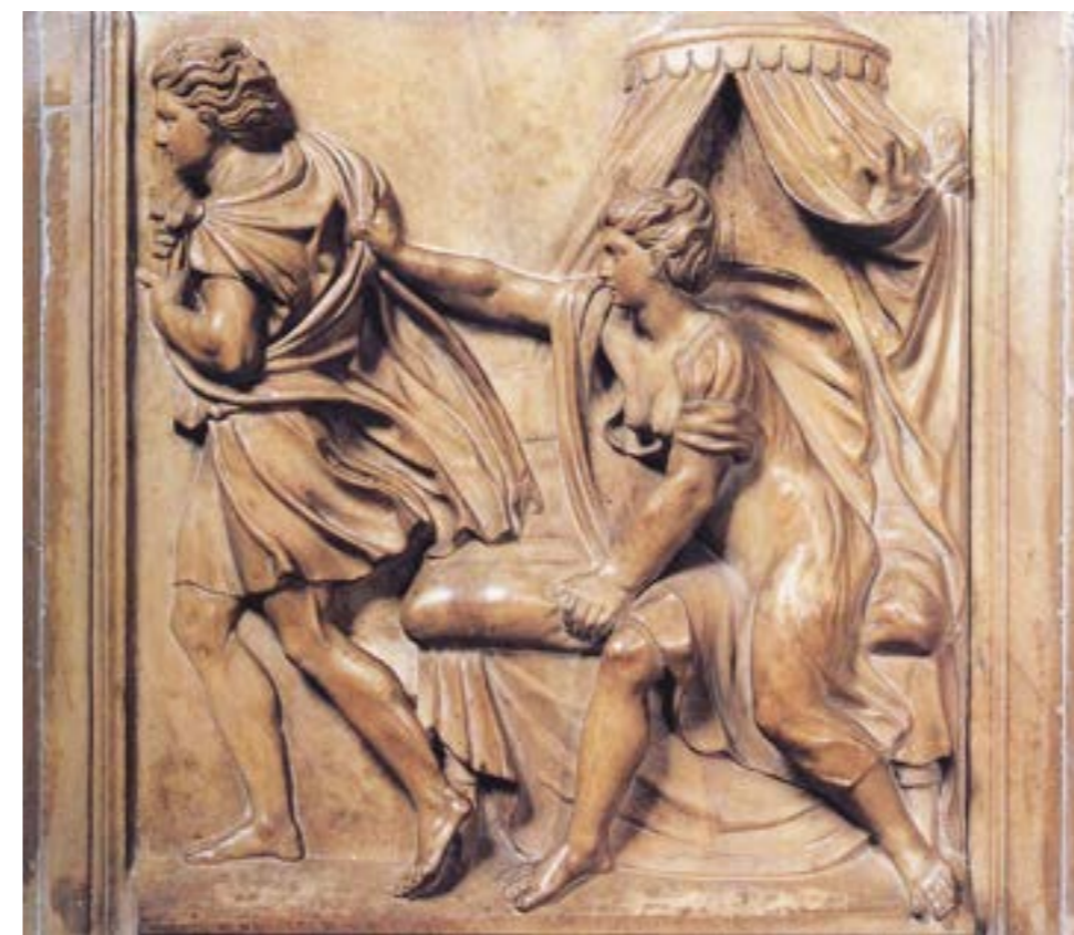
Figura 6: José e a Esposa de Potifar . Fonte: Museo de San Petronio, Bolonha. Imagem em domínio público - editada por Walter Miranda

se como profissional cuja fama espalhou-se por toda a Itália e além, provocando a inveja danosa de um artista concorrente. Era extremamente respeitada na cidade de Bolonha e recebia com frequência a visita de viajantes estrangeiros a mando de reis e nobres de outras regiões, que buscavam notícias dela. O próprio papa Clemente VII (1478-1534) planejou visitá-la, mas ela morreu uma semana antes da viagem dele. Sua morte causou enorme tristeza e