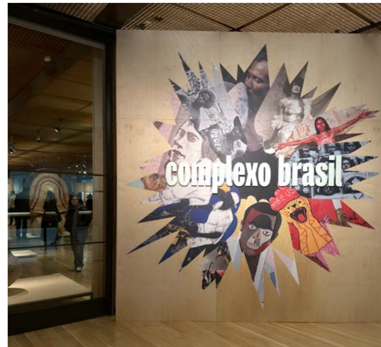
Figura 1: Vista da entrada da exposição “Complexo Brasil”, Fundação Calouste Gulbenkian, Lisboa, fevereiro de 2026. Curadoria de José Miguel Wisnik, Milena Britto e Guilherme Wisnik.

Apesar da disposição das obras não seguir uma cronologia linear, nota-se uma expografia atenta a