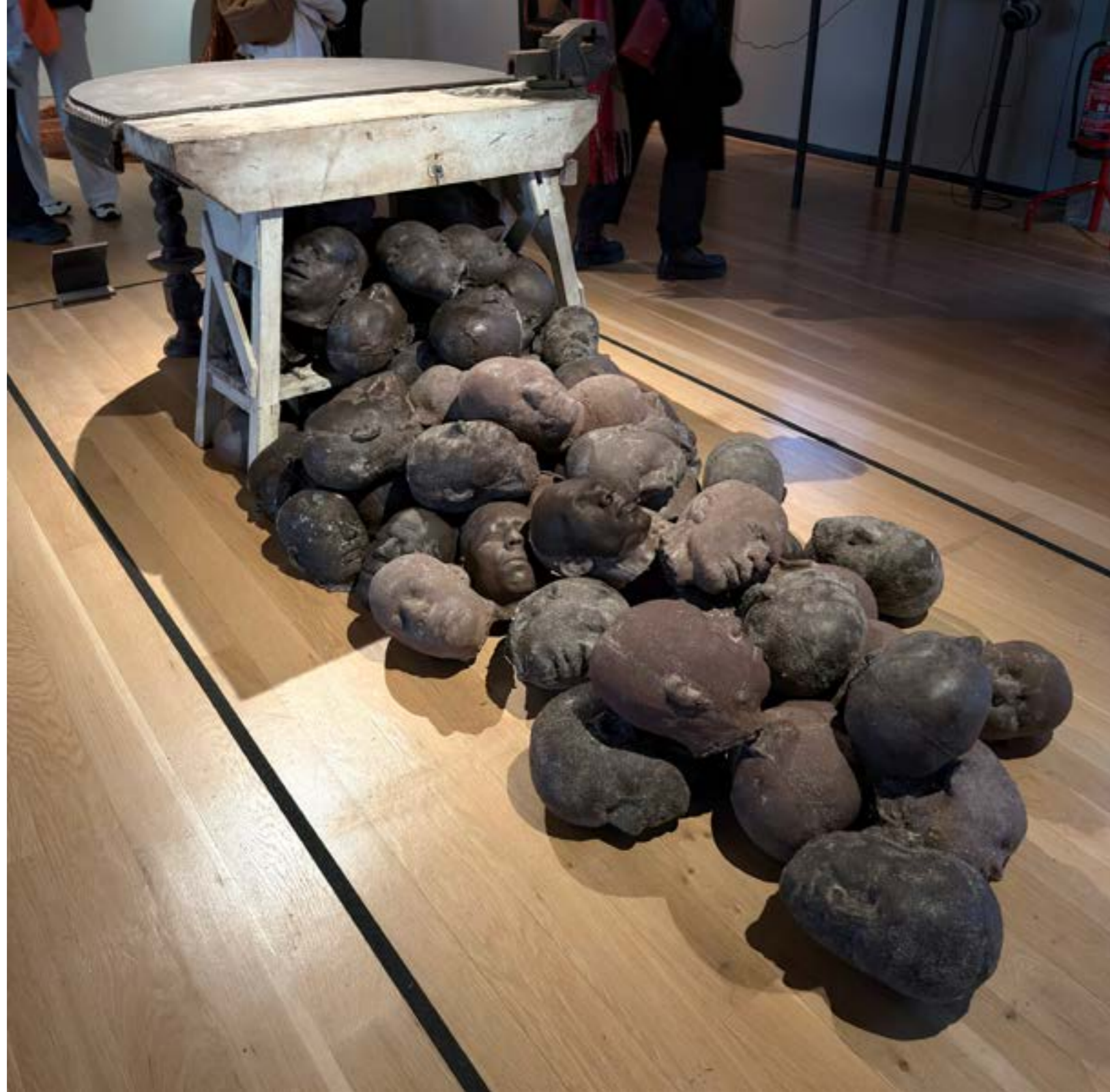
Figuras 7: Delírios de Catharina , de Caetano Dias, e diversas pinturas de Rubem Valentim. Exposição “Complexo Brasil”, Fundação Calouste Gulbenkian, 2026.