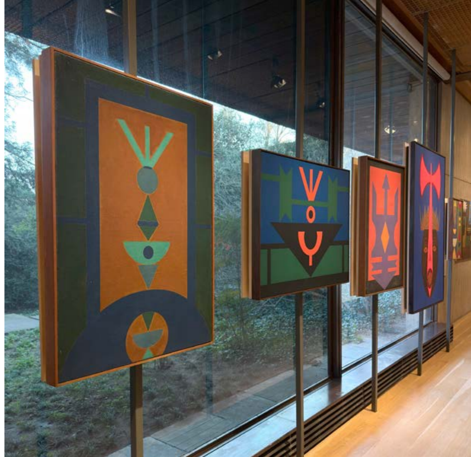
Figuras 8: Delírios de Catharina , de Caetano Dias, e diversas pinturas de Rubem Valentim. Exposição “Complexo Brasil”, Fundação Calouste Gulbenkian, 2026.