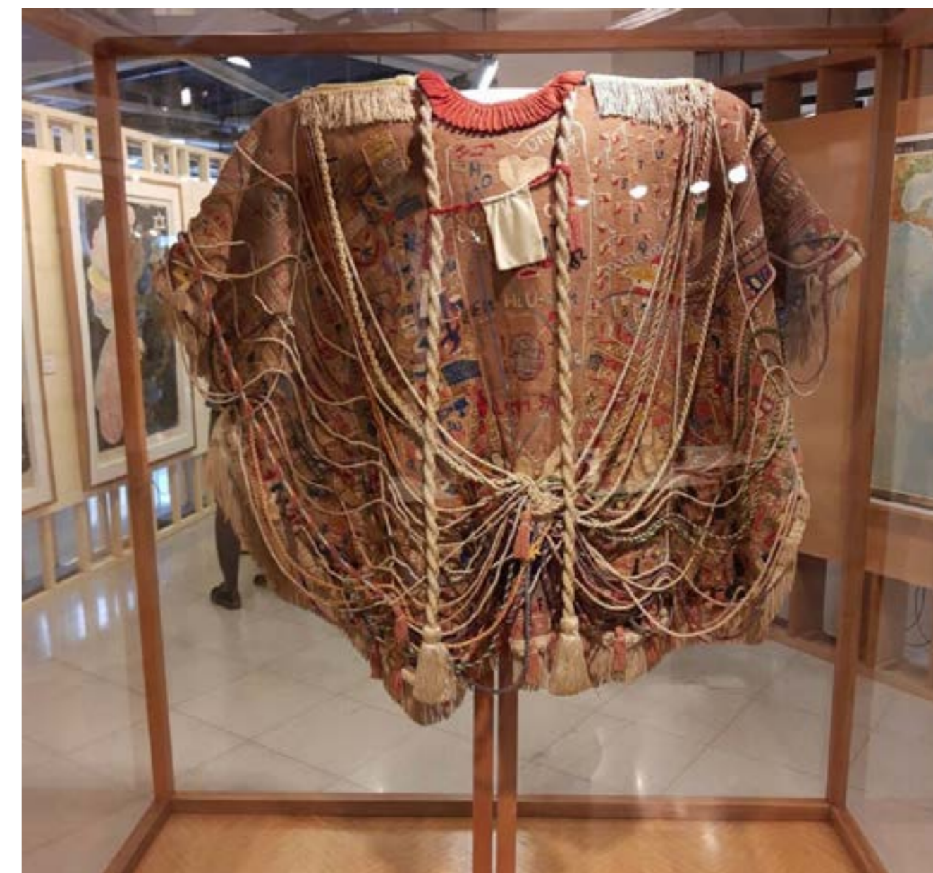
Figura 3: Manto da Apresentação , de Arthur Bispo do Rosário, na exposição “À Nordeste”, ocorrida em 2019 no Sesc 24 de Maio, São Paulo.

Há, também, outros “mantos” expostos mais à frente: os Parangolês de Hélio Oiticica. As peças,