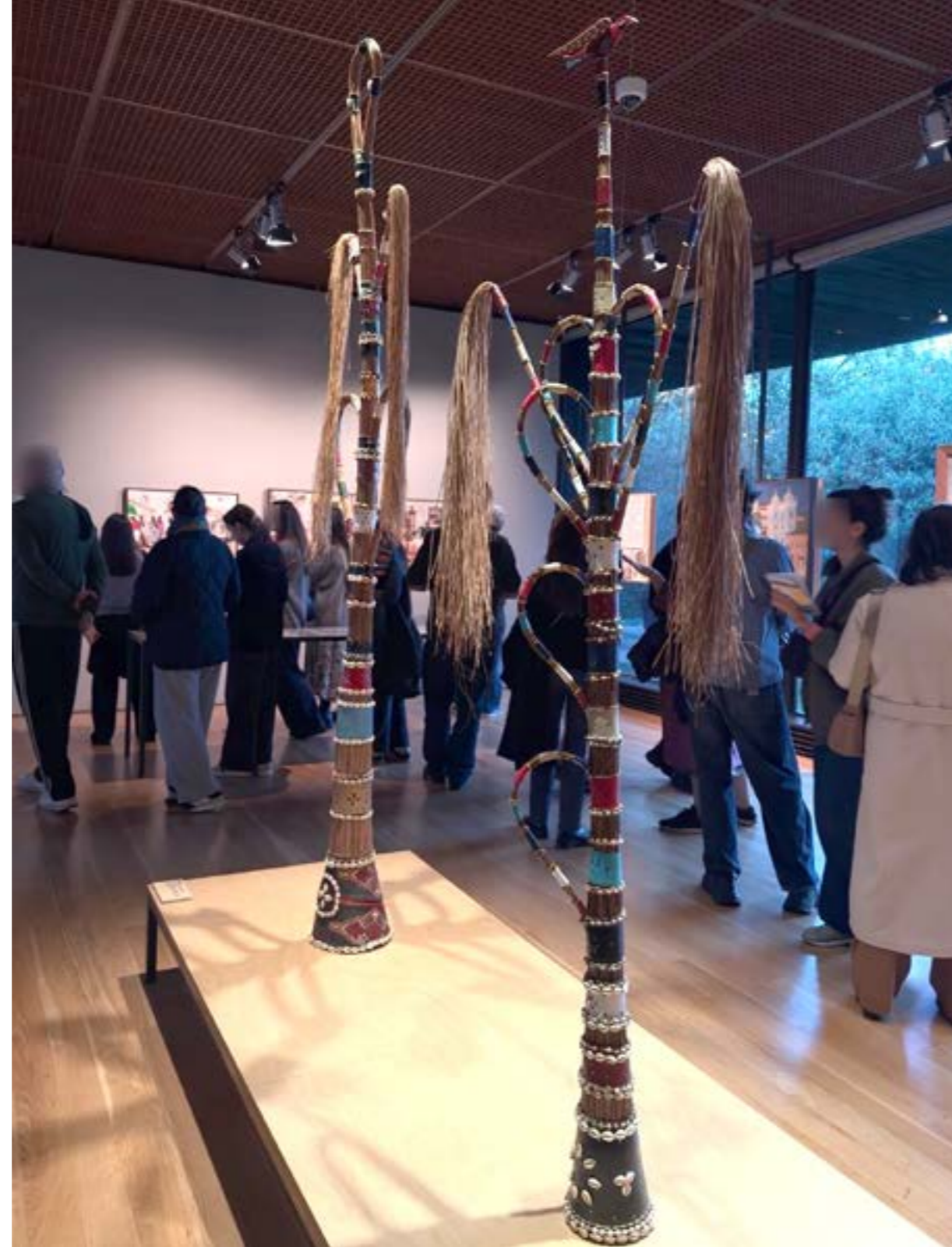
Figura 11: Obras de Mestre Didi. Exposição “Complexo Brasil”, Fundação Calouste Gulbenkian, 2026.

fundamental compreender o contexto de tais obras ao distanciar-se de comparações descabidas (tudo deve ser contextualizado), repudiar a espetacularização e, especialmente, evitar regimes classificatórios que restrinjam as possibilidades interpretativas das produções não ocidentais. Fica evidente que a mostra “Complexo Brasil” fez sua lição de casa nesse aspecto, a começar por privilegiar uma curadoria 100% brasileira (em “Magiciens de la Terre”, por exemplo, todos eram franceses).