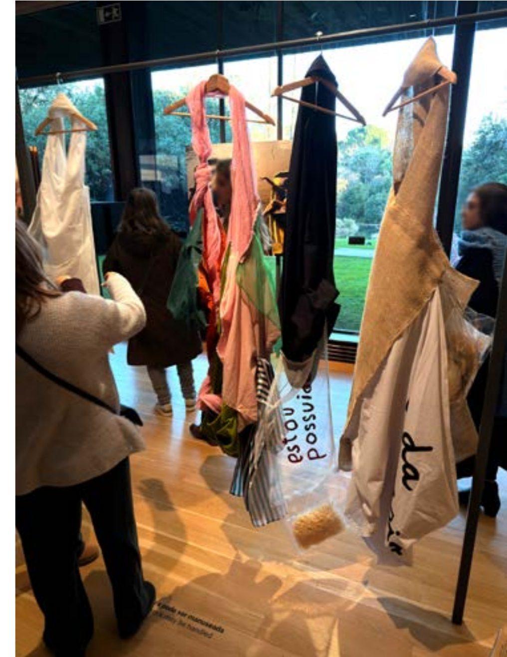
Figura 6: Parangolés , de Hélio Oiticica, na exposição “Complexo Brasil”, Fundação Calouste Gulbenkian, 2026.

Destaca-se aqui, para concluir o piso superior, a seleção das obras de Mestre Didi para integrar a mostra. O renomado artista brasileiro, pouco mais de 36 anos antes, havia integrado a seleção de obras brasileiras expostas na mostra “Magiciens de la Terre”, ocorrida em Paris (Pompidou e Grande Halle de la Villette). A polêmica exposição de 1989 nos deixou algumas lições importantes: embora integrar a arte da periferia global aos grandes centros da arte seja, sim, uma necessidade, é