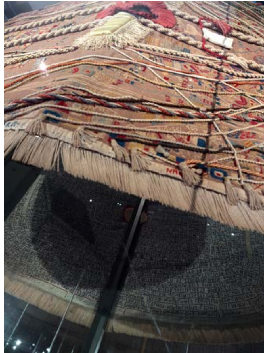
Figuras 4 e 5: Detalhes do Manto da Apresentação , de Arthur Bispo do Rosário, na exposição “Complexo Brasil”, Fundação Calouste Gulbenkian, 2026.

acertadamente, estavam penduradas em cabides e disponíveis para manuseio do público. Ao lado delas, não apenas uma televisão exibindo os parangolés “em ação” - como se fossem um incentivo ao público para vesti-los -, mas também um aviso no chão: “Esta obra pode ser manuseada”.