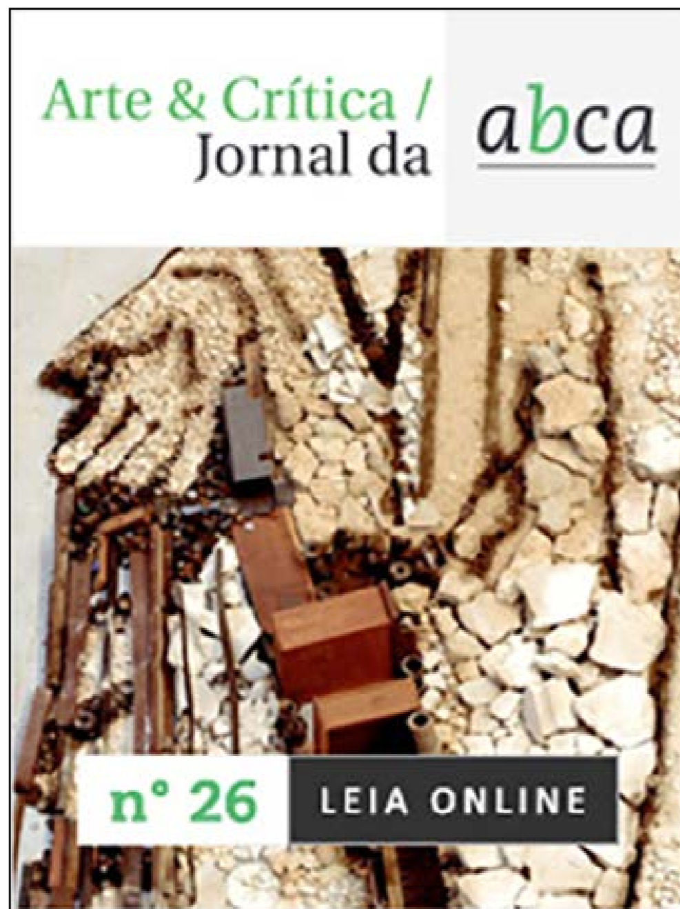
Figura 5. Capa do Jornal ABCA / Arte & Crítica , Ano IX, Número 26, dezembro 2011. Capa disponível em < https://abca.art.br/arte-critica/ >. Acesso em 11/ mai./2026

A partir de 2010, em meio às mudanças administrativas na IMESP e acompanhando as transformações tecnológicas e editoriais, o jornal passou a circular em formato digital, ampliando o acesso ao conteúdo e favorecendo maior difusão nacional