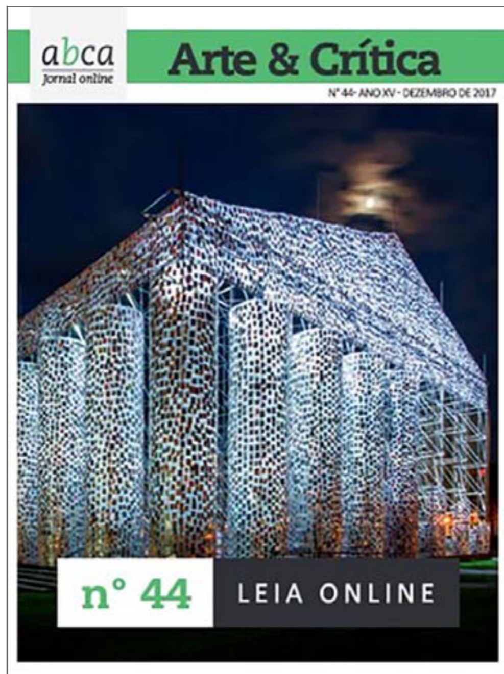
Figura 7. Capa original do Jornal ABCA / Arte & Crítica , Ano XV, Número 44, dezembro de 2017.

É importante registrar que as edições posteriormente reconstruídas passaram a apresentar apenas o título Arte & Crítica (Figura 8), já em conformidade com o modelo gráfico implantado em 2022. Por essa razão, o site atualmente pode sugerir que a mudança de nome ocorreu antes dessa data. Contudo, a publicação original ainda circulava