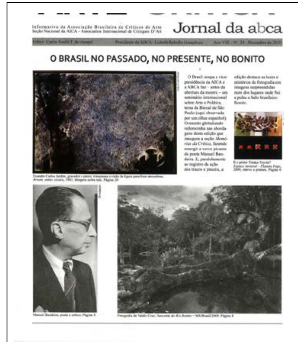
Figura 4. Capa do Jornal da ABCA / Arte & Crítica , Ano VIII, Número 24, dezembro de 2010. Disponível em < https://abca.art.br/wp-content/uploads/2024/05/2010DezembroAnoVIIIDez24ArteeCritica.pdf >. Acesso em 11/mai./2026

Na Assembleia Geral Ordinária de 4 de junho de 2007, anunciou-se um novo formato editorial e a adoção