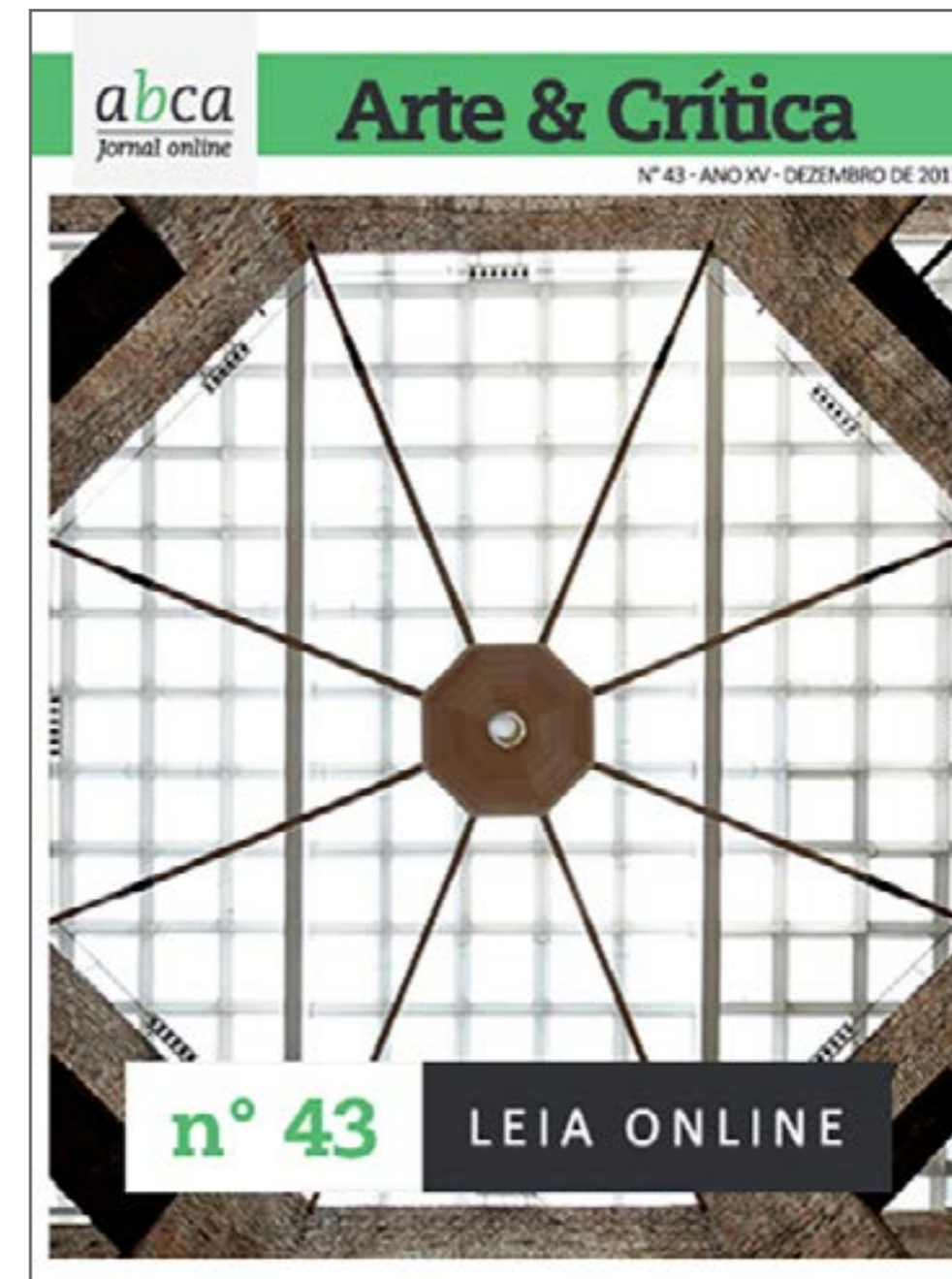
Figura 6. Capa do Jornal ABCA / Arte & Crítica , Ano XV, Número 43, dezembro 2017 (mas na realidade foi de setembro de 2017 - arquivo com equívoco). Capa disponível em < https://abca.art.br/arte-critica/ >. Acesso em 11/ mai./2026