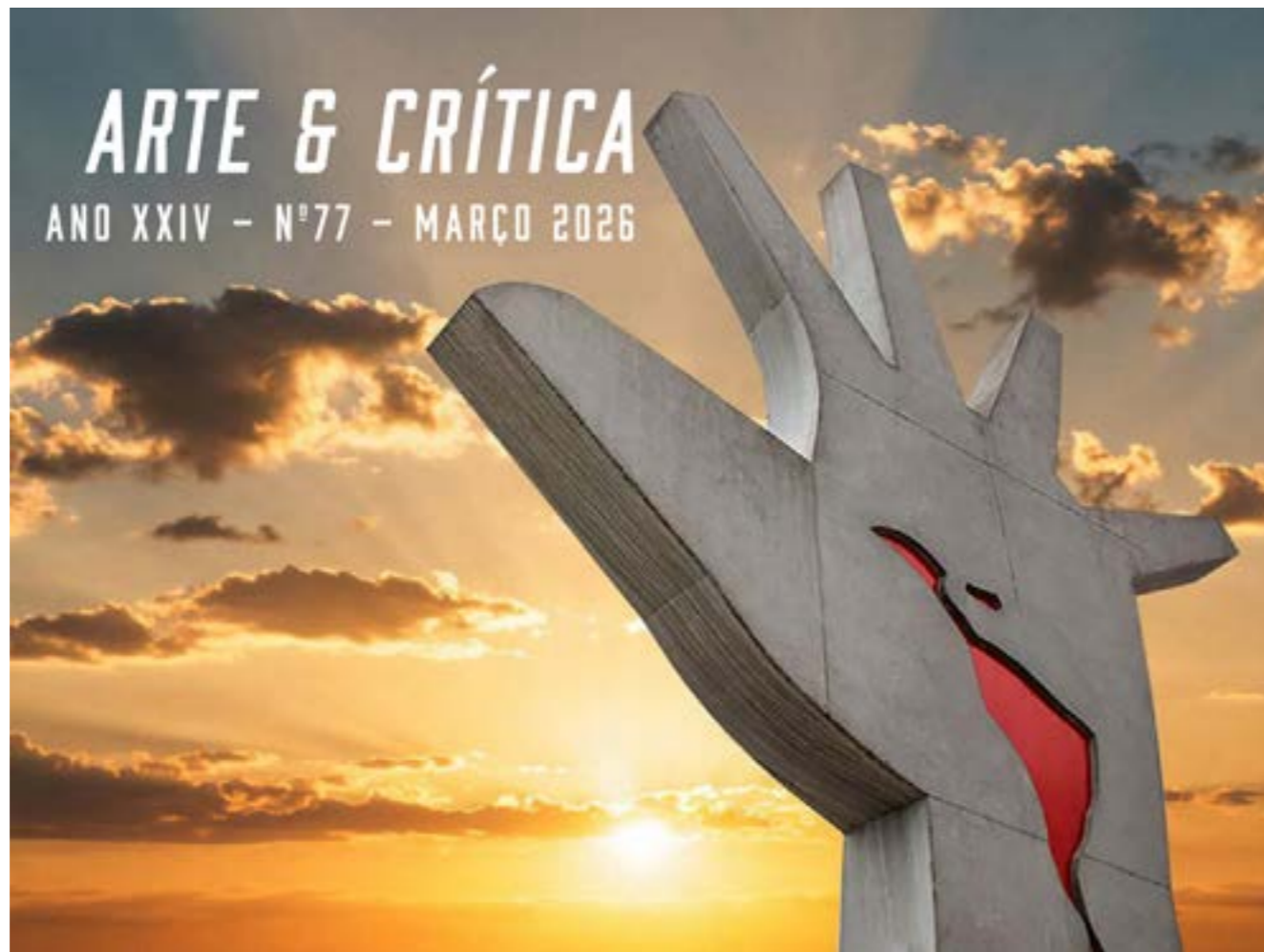
Figura 12. Capa da revista Arte & Crítica , Ano XXIV, Número 77, março de 2026. Disponível em < https://abca.art.br/arte-critica/ >. Acesso em 11/mai./ 2026

A continuidade da publicação entre 2001 e 2026 revela um dos períodos mais estáveis e duradouros da história editorial da ABCA. Além de funcionar como meio de comunicação institucional, o periódico tornou-se um importante arquivo da crítica