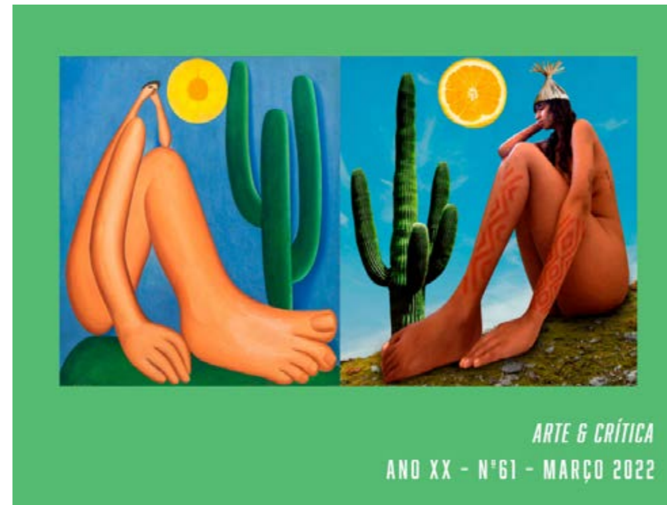
Figura 11. Capa da agora denominada Revista Arte & Crítica , Ano XX, Número 61, março de 2022. Disponível em < https://abca.art.br/arte-critica/ >. Acesso em 11/mai./2026

A revista consolidou e ampliou o perfil acadêmico iniciado em 2019, mantendo ISSN, seção internacional e Conselho Editorial, além de reunir artigos de críticos associados e convidados do Brasil e do exterior, ensaios, resenhas de livros e exposições. Seu conselho passou a contar com pesquisadores e professores vinculados a universidades brasileiras e também da Argentina, Chile, Estados Unidos, Espanha e França. O corpo editorial reúne críticos e estudiosos dedicados à pesquisa em história da arte, crítica contemporânea, circulação internacional da arte, entrevistas com artistas, lançamentos editoriais e reflexões sobre arte, meio ambiente e suas interlocuções com as ciências.