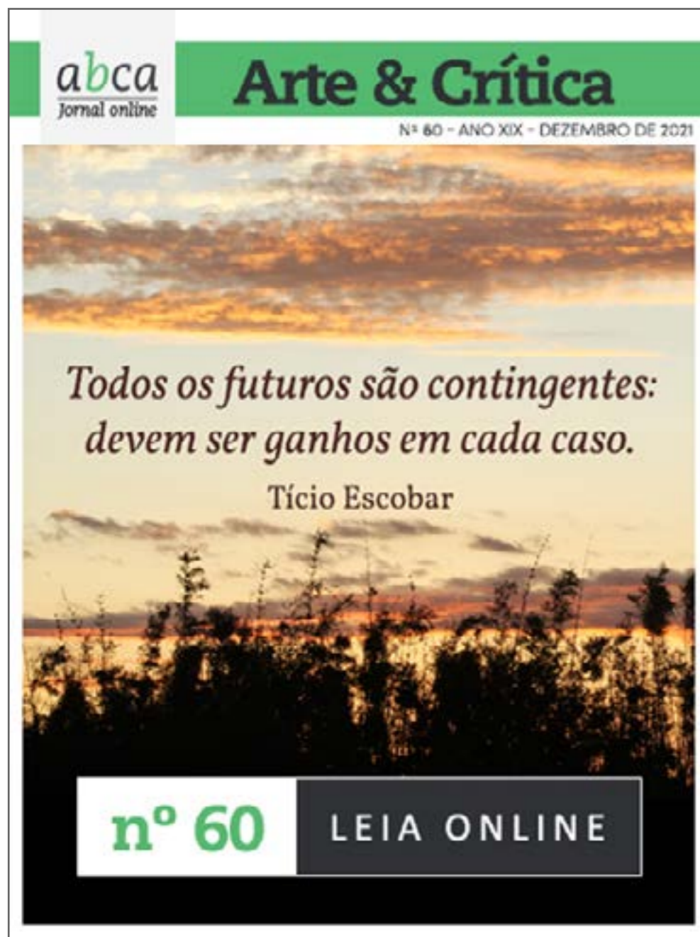
Figura 9. Capa original do Jornal ABCA / Arte & Crítica , Ano XIX, Número 60, dezembro de 2021.