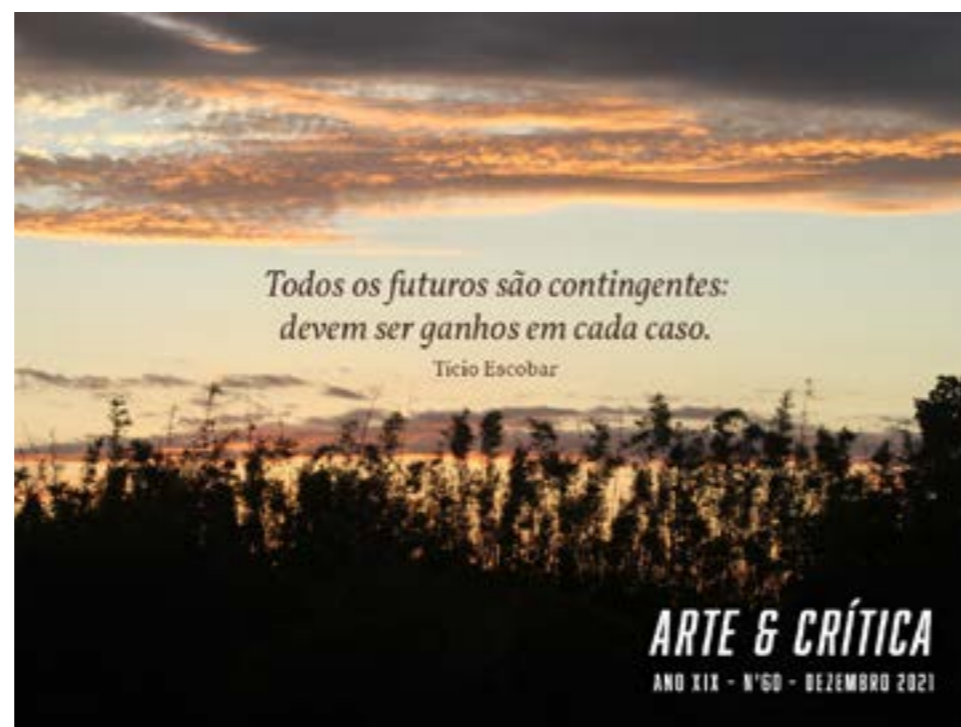
Figura 10. Capa do período do Jornal ABCA / Arte & Crítica (publicado depois da reconstituição após 2022, já na nova versão da revista), Ano XIX, Número 60, dezembro de 2021.