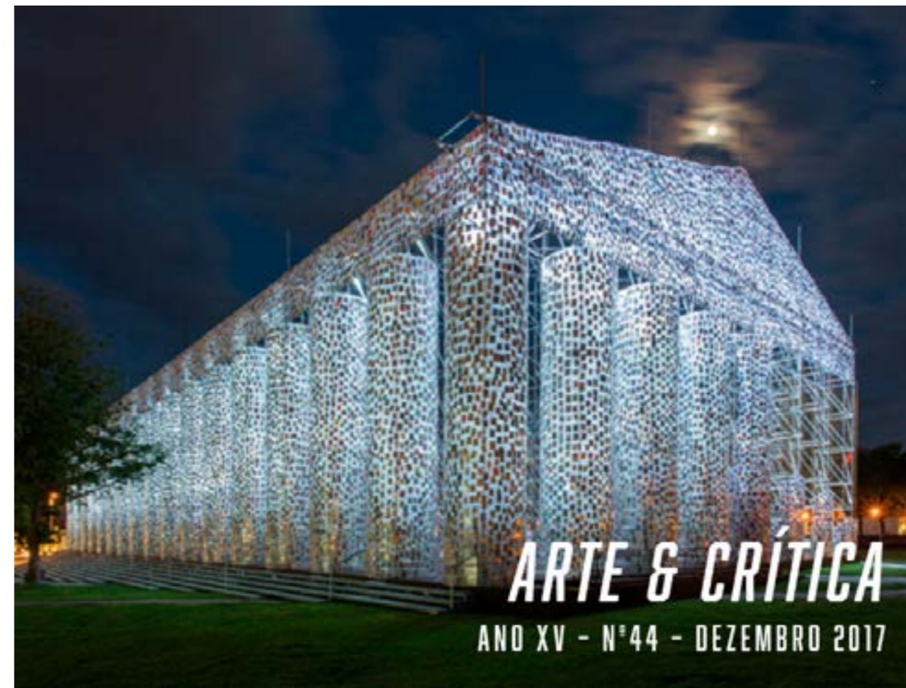
Figura 8. Capa do período do Jornal ABCA / Arte & Crítica (mas publicado depois da reconstituição após 2022, já na nova versão da revista), Ano XV, Número 44, dezembro de 2017. Capa disponível em < https://abca.art.br/arte-critica/ >. Acesso em 11/mai./2026

com o título Jornal da ABCA / Arte & Crítica (ver Figura 7 e comparar com a Figura 8 atualmente disponível no site).