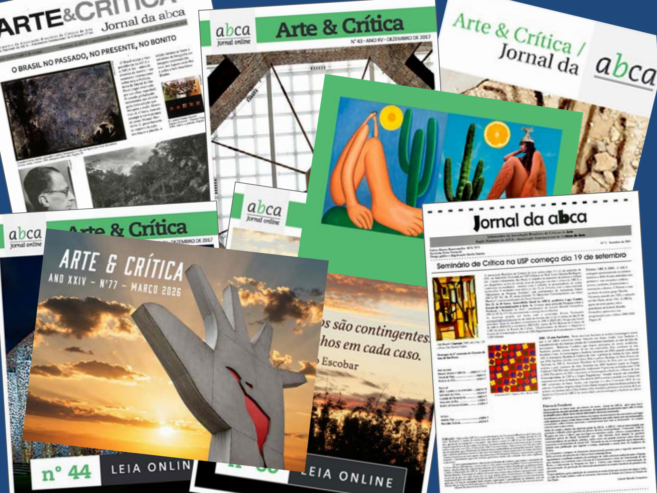
Arte com imagens das capas da Revista Arte & Crítica