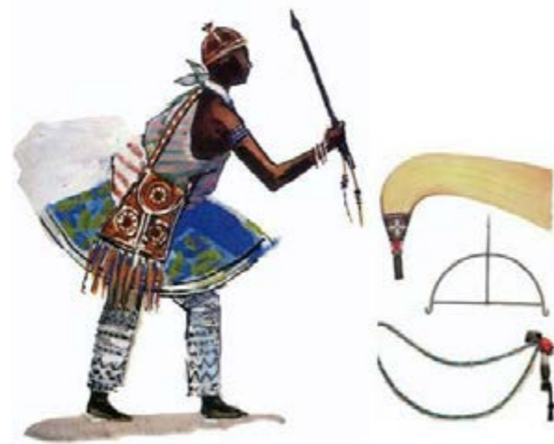
Figuras 6 e 7. Iconografias do orixá Oxóssi, de Carybé Painel entalhado do Museu Afro-Brasileiro da Universidade Federal da Bahia, 1968. Aquarela do livro Iconografia dos Deuses Africanos no Candomblé da Bahia , 1980

As duas representações apresentam de maneira diversificada o orixá Oxóssi, representado com suas ferramentas, contas e animais relacionados à caça. A primeira representação é uma placa de madeira de cedro com aproximadamente 3 x 1 x 0,10 m, em que está entalhada a iconografia do orixá e pertence ao acervo do Museu Afro-Brasileiro da Universidade Federal da Bahia, enquanto a segunda representação é uma aquarela da iconografia do orixá, o qual está em posição que remonta o ato da caçada, juntamente com o ofá e outras insígnias. A reprodução desta aquarela é uma das representações de orixás do livro Iconografia dos Deuses Africanos no Candomblé da Bahia (1980).