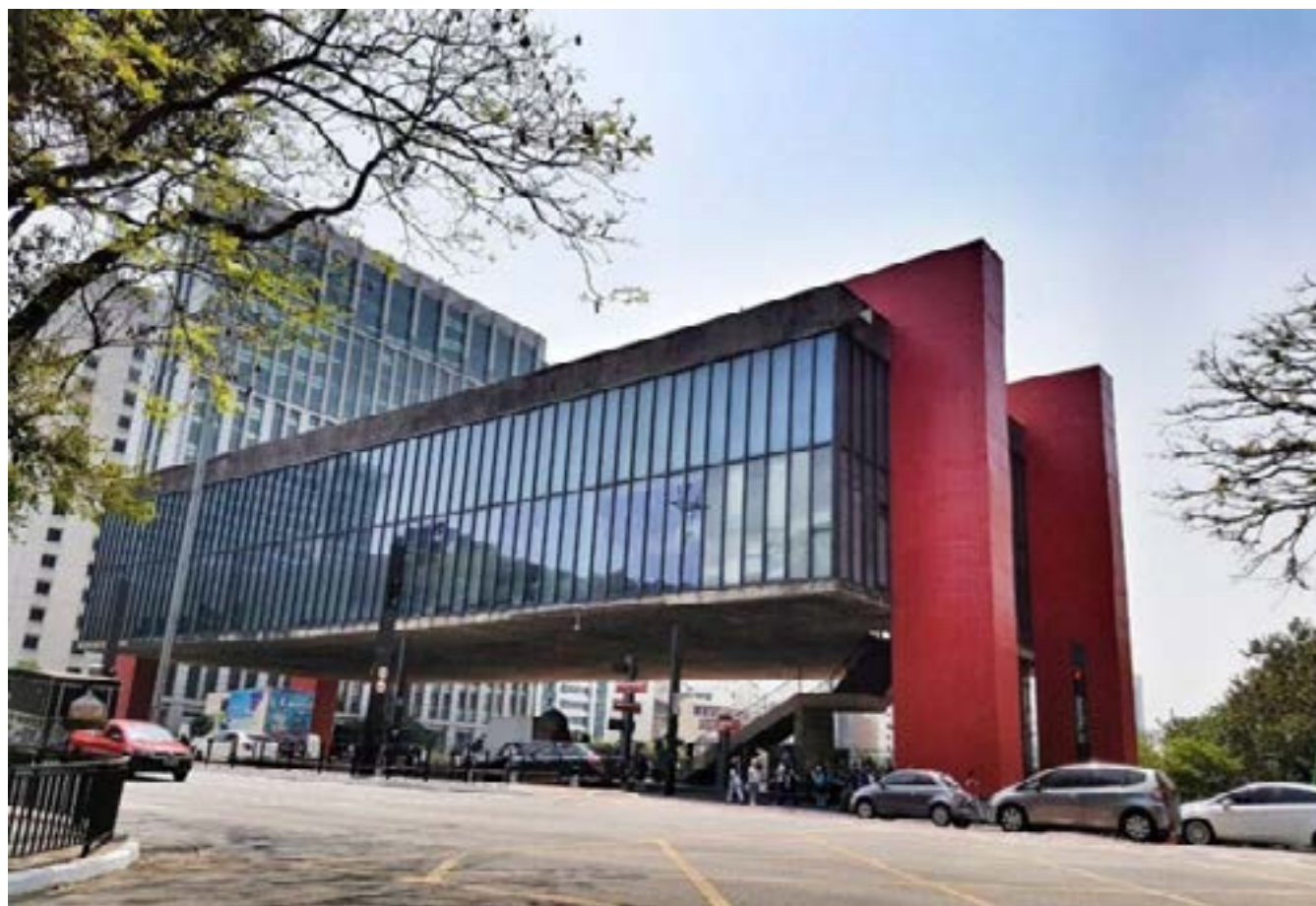
Figura 1. Museu de Arte de São Paulo Assis Chateaubriand-MASP