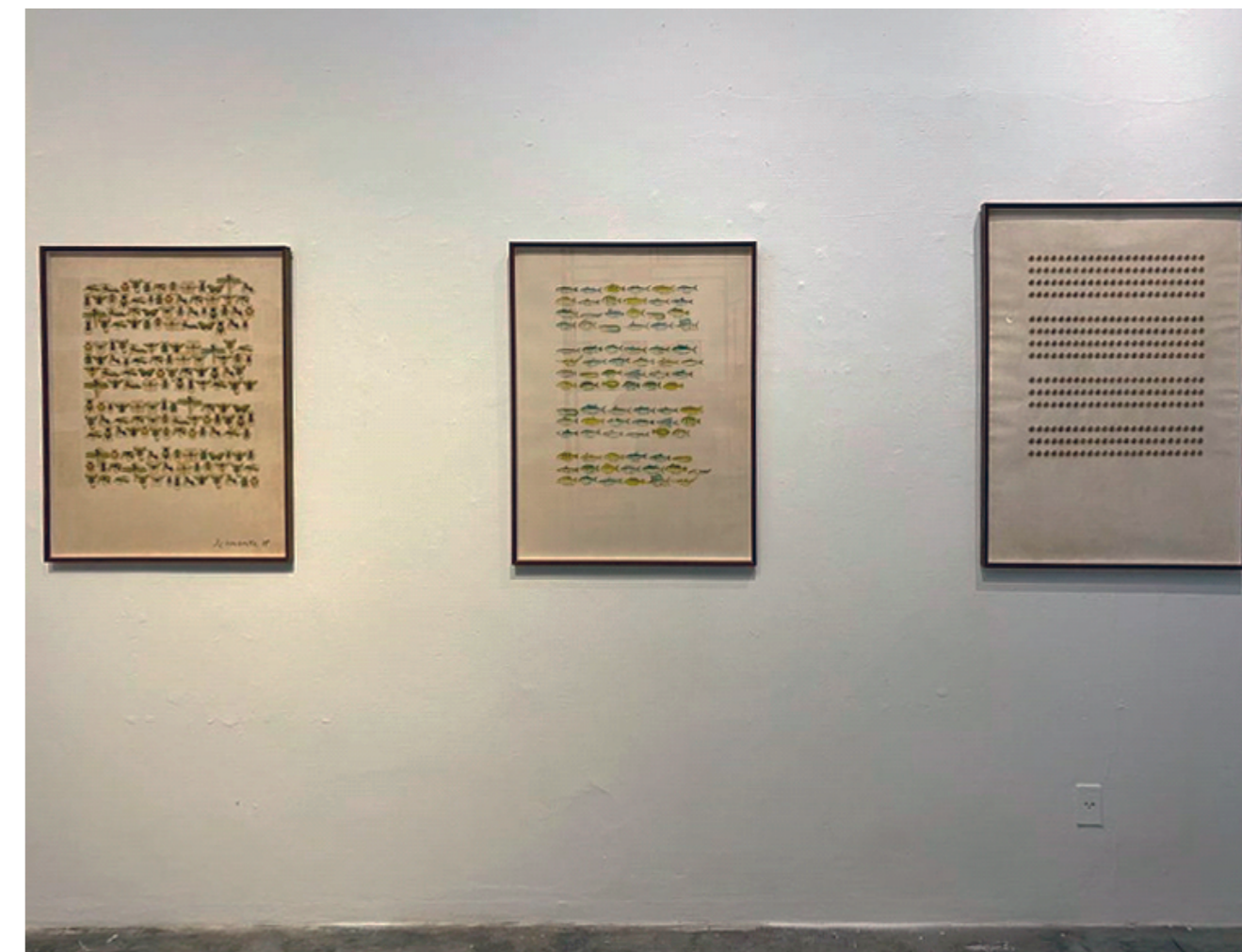
Fig. 3: Exposição Schwanke: Sonetos Visuais.

produziu um menor número de trabalhos, com decalcomanias, um tipo de adesivo de transferência aplicado sobre uma superfície para decorar papéis,