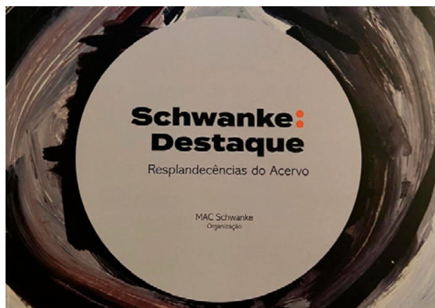
Fig. 1: Capa do livro.