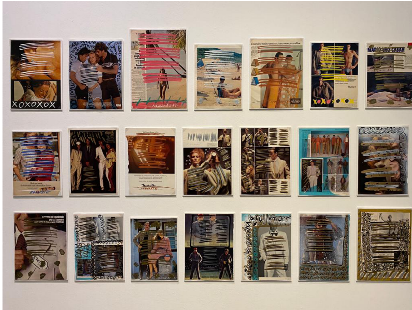
Fig. 4: Luiz Henrique Schwanke, Sonetos .

também nos cadernos escolares, eles têm um aspecto um pouco naïf . Nesse conjunto de obras, a sequência de inúmeros desses adesivos compõe as linhas dos versos, são figuras