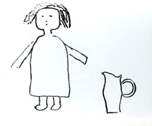
Fig. 3: Menina com o Jarro , desenho de Oswald de Andrade, ilustração do livro Primeiro Caderno do Aluno de Poesia Oswald de Andrade , 1927.