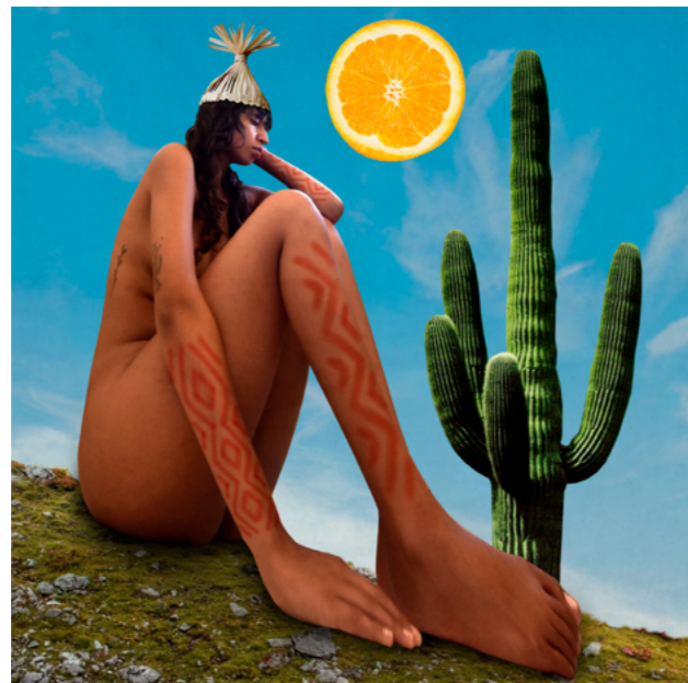
Fig. 4: Tapuya Abaporu, Kadu Xucuru. Colagem digital.

2022). A afirmação “Só a antropofagia nos une”, presente no manifesto, se tornou atualmente uma pergunta, “Só a Antropofagia nos Une?”, estampada na capa da revista The Brooklyn Rail, lançada em fevereiro de 2021 e coeditada pela escritora norte-americana Sara Roffino e pelo artista brasileiro Tiago Gualberto. A edição traz textos de vários autores e