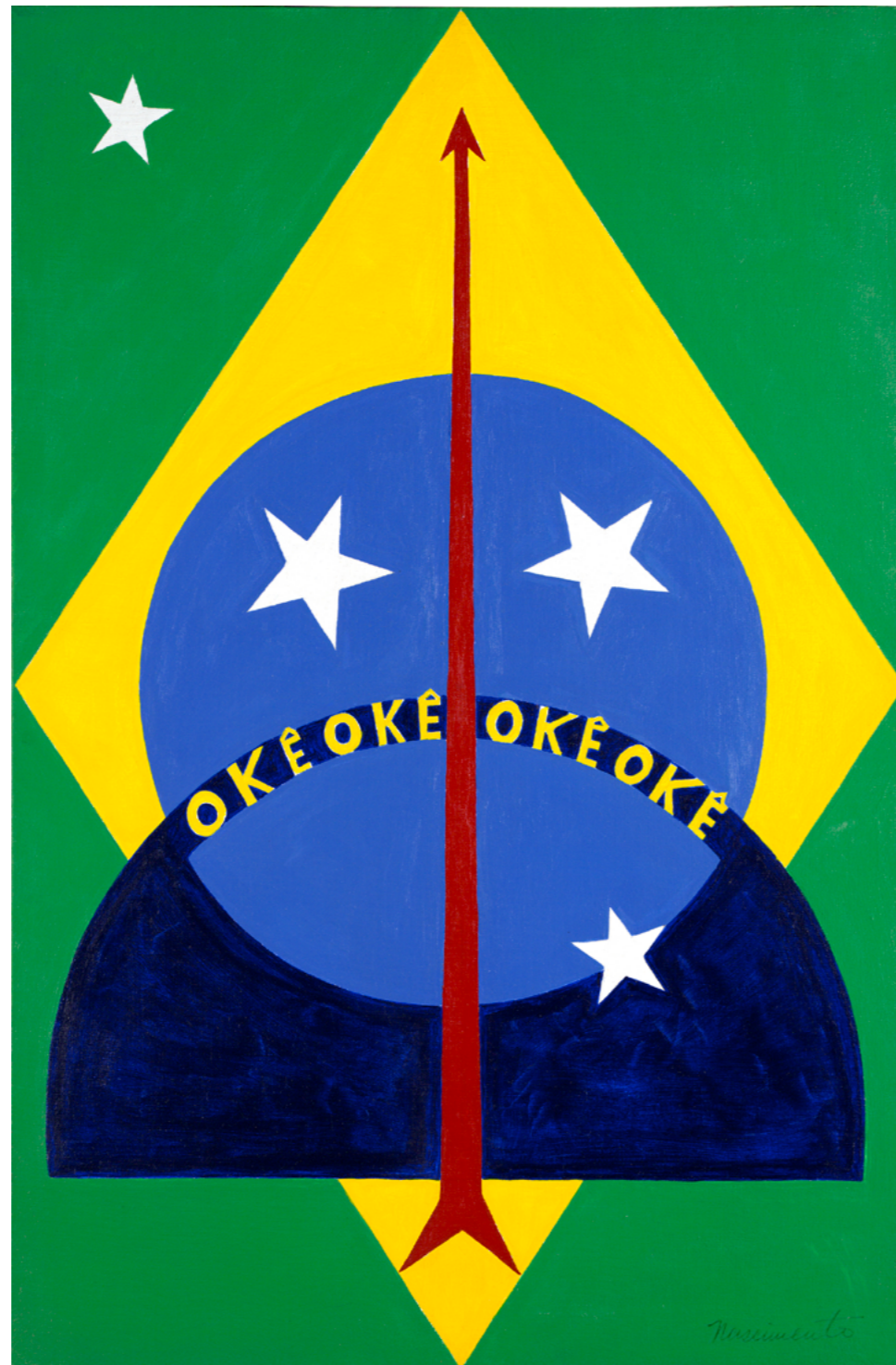
Fig. 6: Okê Oxóssi, Abdias Nascimento, 1970.

A revisão crítica sobre as narrativas estabelecidas a partir da Semana de 22 também foi o ponto de partida para a proposta curatorial da exposição “Nakoada”, com curadoria de Denilson Baniwa e Beatriz Lemos, que ficará em cartaz no MAM do Rio de Janeiro, entre julho de 2022 e janeiro de 2023. Com projetos comissionados