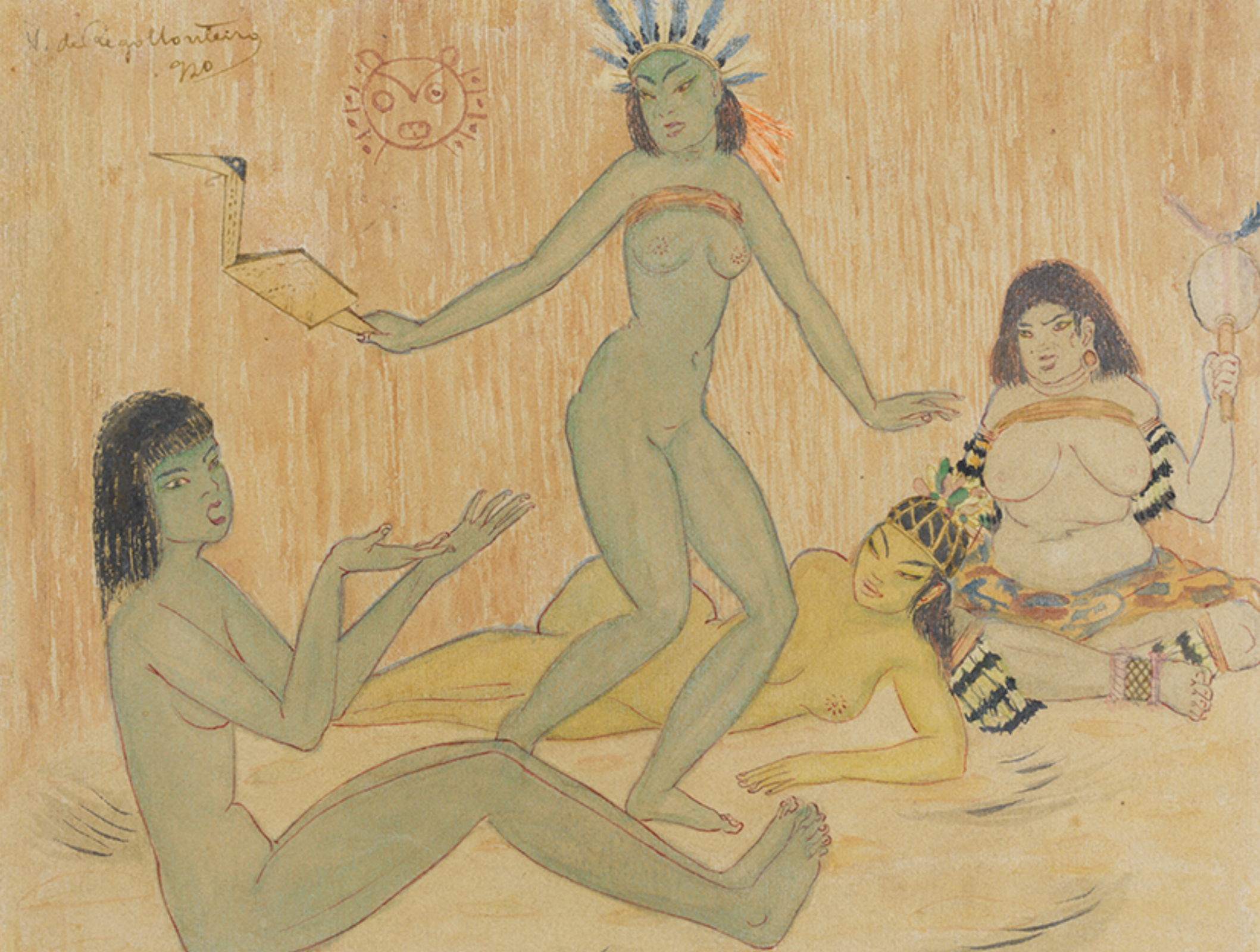
Fig. 12 (página ao lado): Lendas indígenas da Amazônia, Vicente do Rego Monteiro, 1920. Aquarela sobre papel. Coleção Gilberto Chateaubriand MAM Rio.