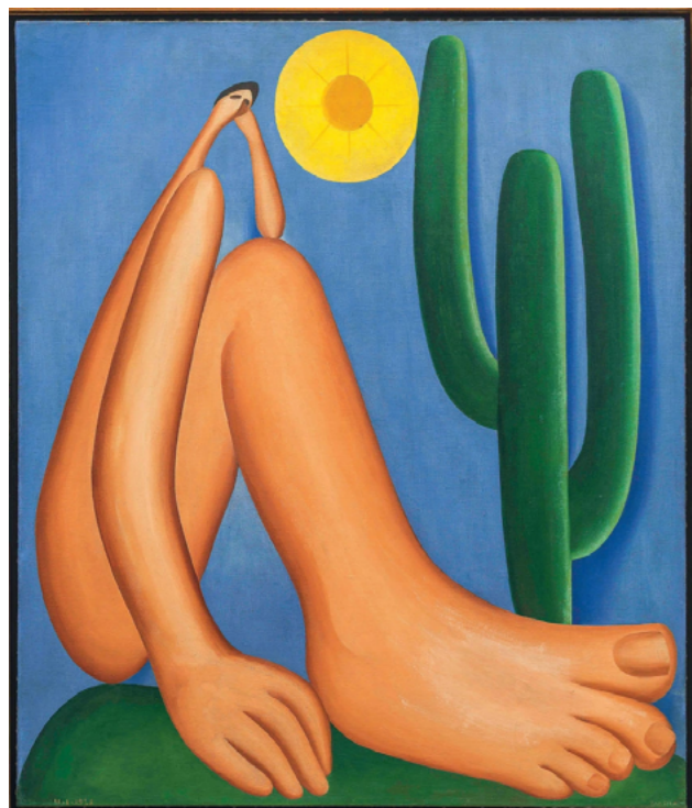
Fig. 3: Abaporu, Tarsila do Amaral, 1928. Óleo sobre tela.

2022). A afirmação “Só a antropofagia nos une”, presente no manifesto, se tornou atualmente uma pergunta, “Só a Antropofagia nos Une?”, estampada na capa da revista The Brooklyn Rail, lançada em fevereiro de 2021 e coeditada pela escritora norte-americana Sara Roffino e pelo artista brasileiro Tiago Gualberto. A edição traz textos de vários autores e