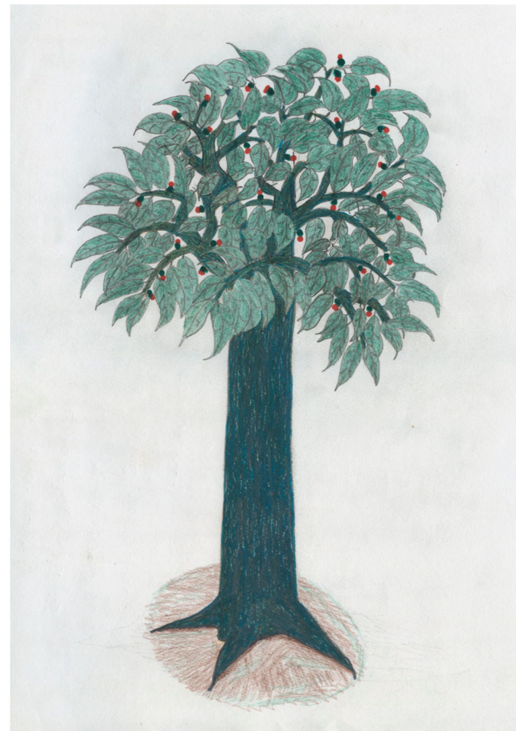
Fig. 7: Sem título, Josefa Yanomami, 2011. Acervo MASP, crédito Instituto Socioambiental.