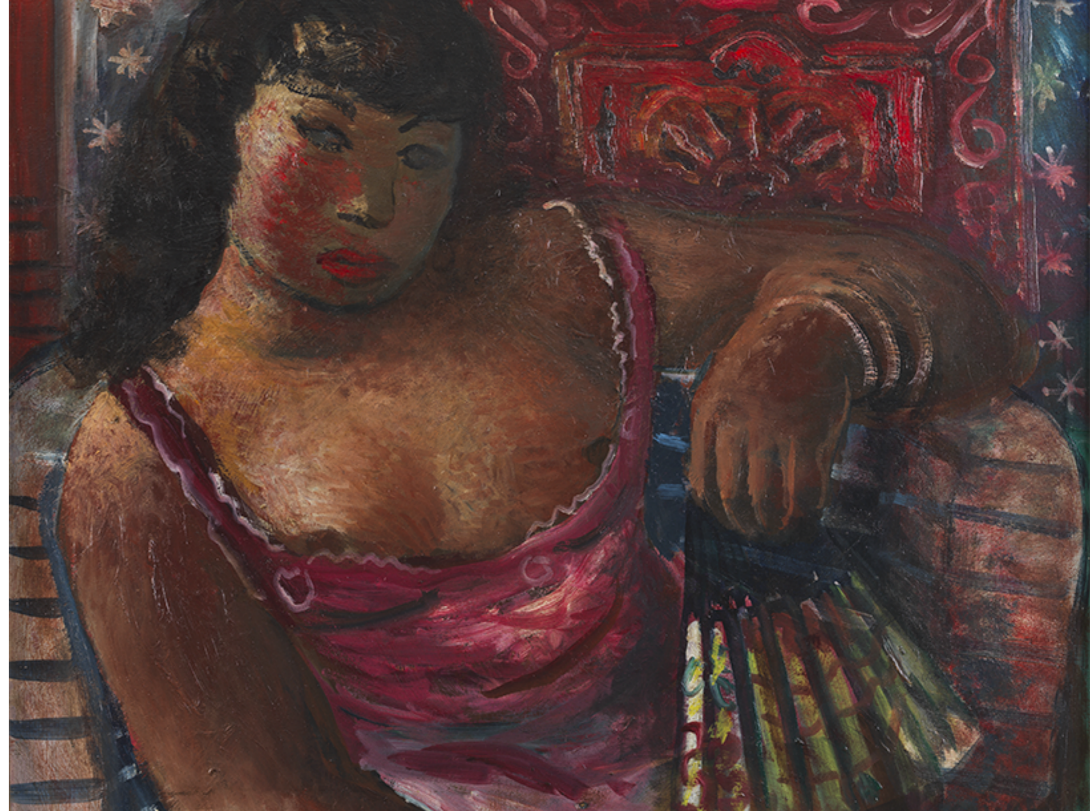
Fig. 8: Imagem na página seguinte: Mulata com leque, Emiliano Di Cavalcanti, 1937. Óleo sobre tela. Coleção Gilberto Chateaubriand. MAM Rio. Imagem: reprodução.

Até mesmo a exposição “Luiz Zerbini: a mesma história nunca é a mesma”, curada por Adriano Pedrosa, diretor artístico, MASP, e Guilherme Giufrida, curador assistente, pode ser interpretada dentro do viés da releitura da Semana de 22. A ideia de que “a mesma história nunca é a mesma” aponta para a repetição das histórias ao longo dos séculos, bem como para a necessidade de se criar outras narrativas para esses episódios, fazendo emergir novas leituras, protagonistas e imagens. Com cerca de 50 trabalhos, em sua maioria inéditos, a exposição inclui cinco pinturas de grandes dimensões de forte impacto estético, quatro