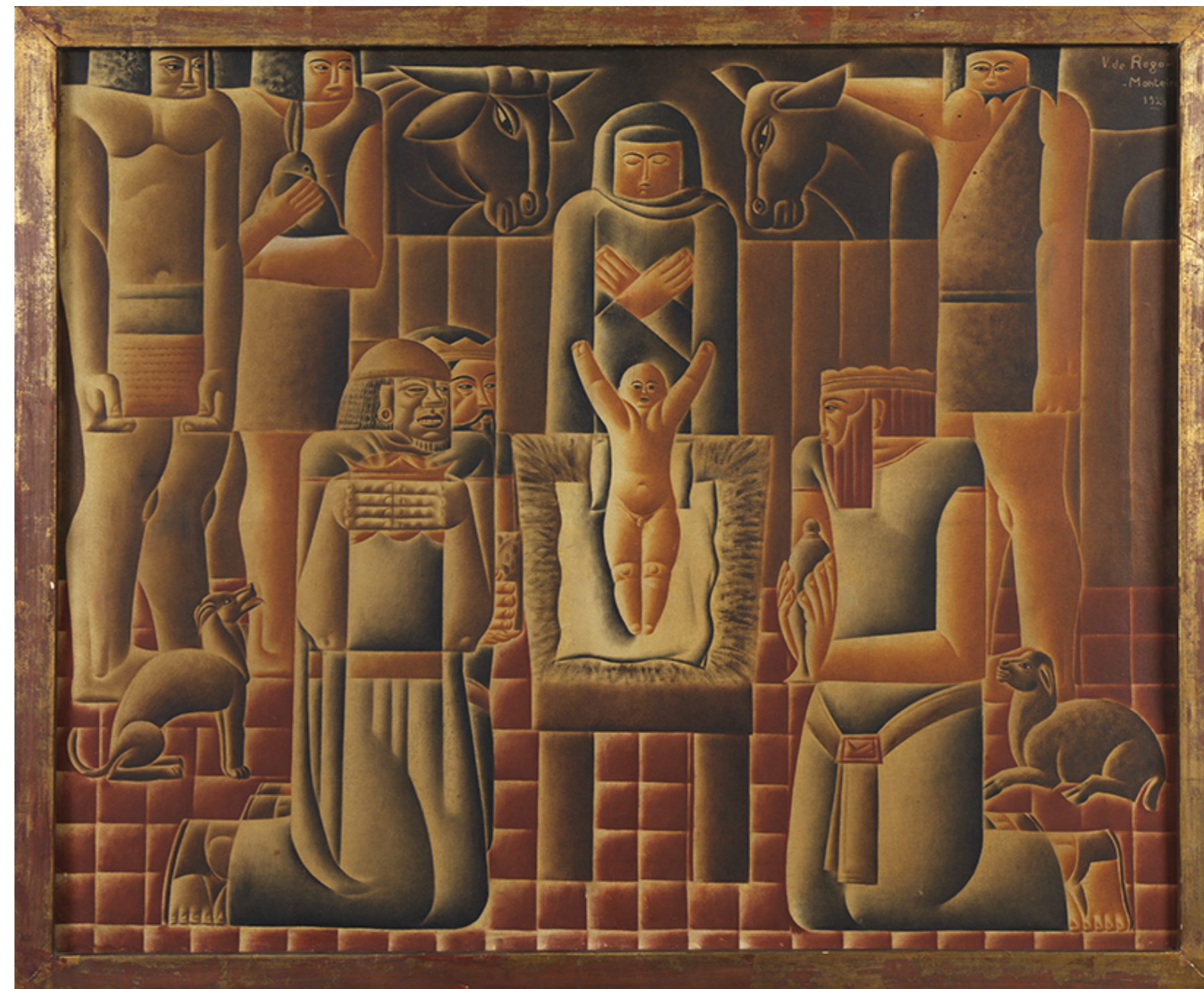
Fig. 2: Adoração dos Reis Magos, Vicente do Rego Monteiro, 1925. Óleo sobre tela. Coleção Gilberto Chateaubriand MAM Rio.

Se a antropofagia modernista ainda não estava contextualizada pela tensão entre raça-etnia e gênero, atualmente, este tem sido o mote de sua revisão crítica. Afinal, no Manifesto Antropofágico, de Oswald de Andrade, em 1928, não havia realmente nenhuma menção acerca da cultura afro-brasileira (CARDOSO, p. 207,