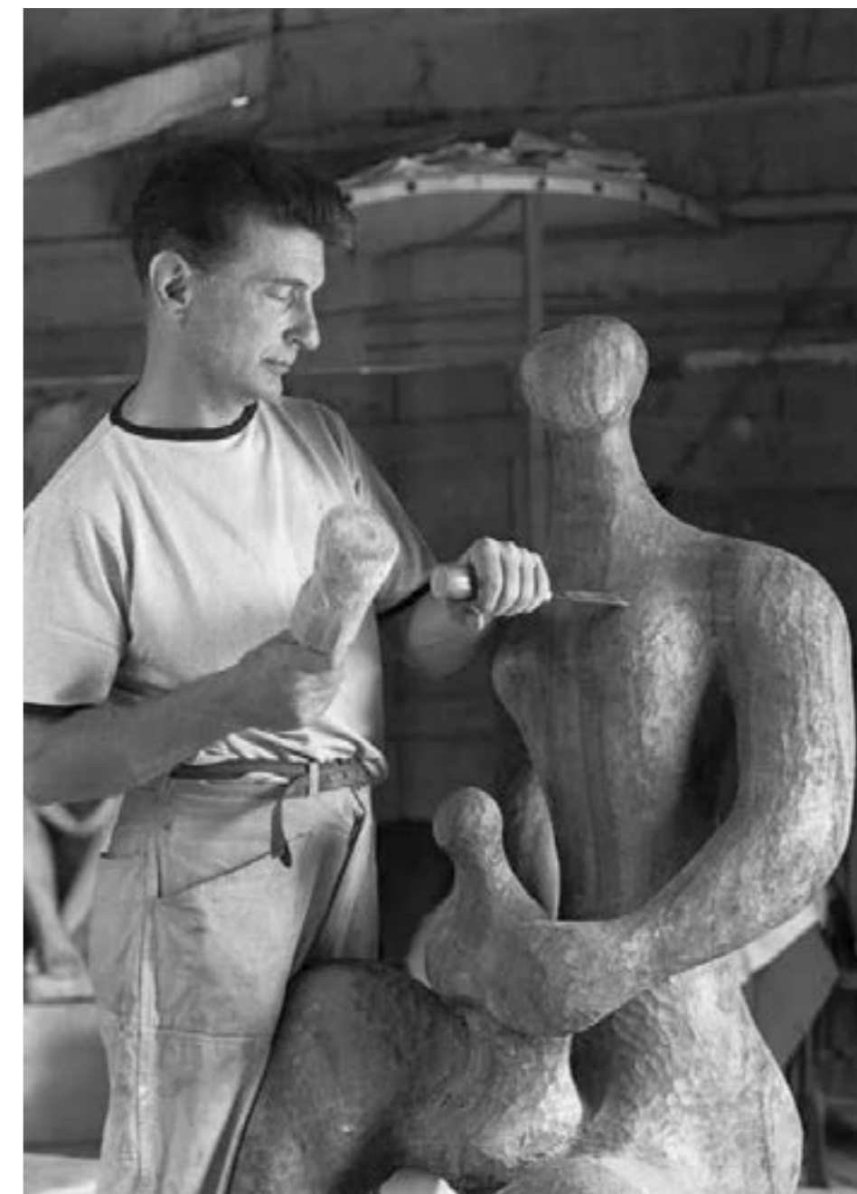
Figura 3 - Bruno Giorgi

Instalado em São Paulo, aproximou-se de importantes figuras do meio artístico e intelectual, entre elas Alfredo Volpi e Joaquim Figueira. Em 1937, viajou a Paris, onde frequentou academias livres como a Académie de la Grande Chaumière