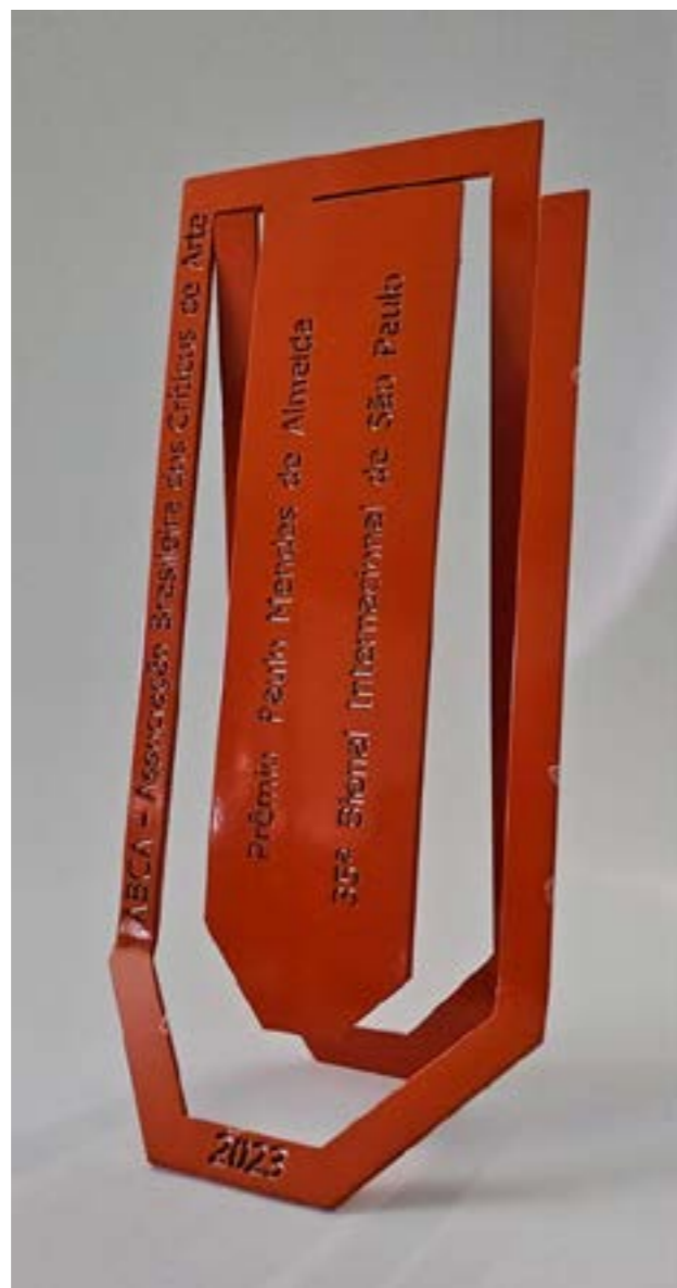
Figura 11 - Prêmio ABCA 2023, por Sanagê Cardoso.

A partir de 2004, dedica-se intensamente à produção de esculturas em aço carbono e aço inoxidável. Seu trabalho dialoga com a tradição da escultura construtiva brasileira, evocando afinidades com a obra de artistas como Amílcar de Castro, Franz