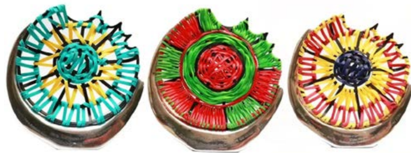
Figura 13 - Troféu da Coleção Jógnam ( Mordida em Kaingang). Coletivo Kókir: Tadeu Kaingang e Sheilla Souza. 21 x 22 x 3 cm, 2025.

O título Jógnam , que significa “mordida” em Kaingang, traduz a poética da série. Uma mordida aqui não é apenas um gesto físico, mas um símbolo multifacetado de dor, esperança e renovação. O coletivo tece em suas obras o trançado, que na cosmovisão Kaingang representa o pensamento e a própria forma de existir.