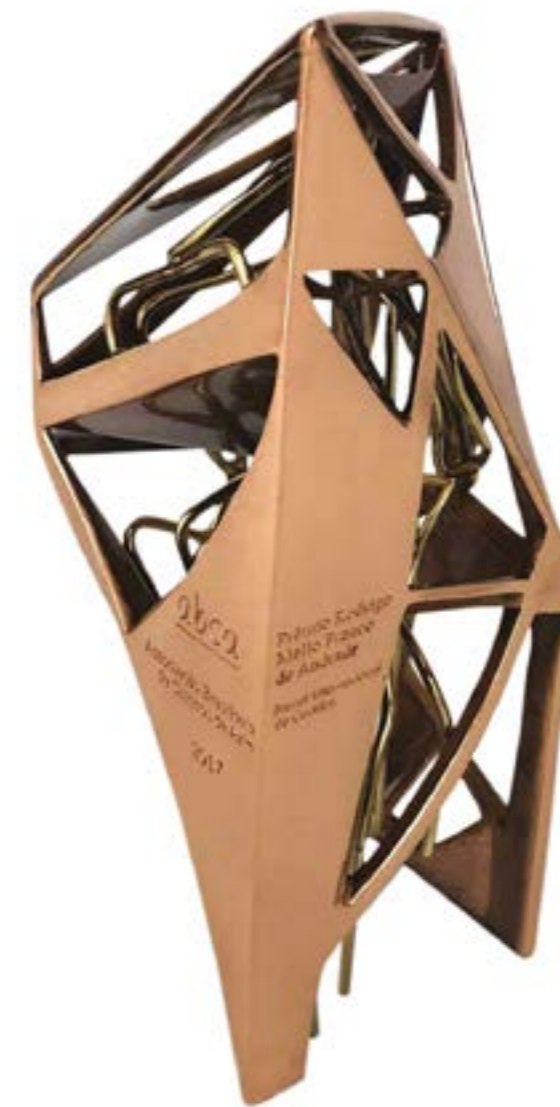
Figura 8 - Prêmio ABCA 2016-2018, por Maria Bonomi.

A obra de Bonomi inscreve-se, assim, na confluência entre gravura, escultura e arquitetura, afirmando uma poética marcada pela intensidade do gesto, pela potência da matéria e pela convicção de que a arte pode operar como forma de memória coletiva e inscrição sensível no espaço da cidade. Sua produção representa também uma inflexão significativa na tradição da gravura brasileira, ao