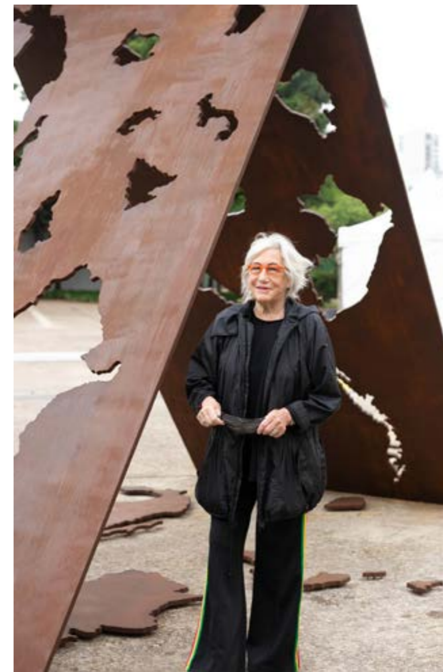
Figura 7 - Maria Bonomi

Sua formação inicia-se no princípio da década de 1950, quando estuda pintura e desenho com Yolanda Mohalyi, em 1951, e posteriormente com Karl Plattner, em 1953. No mesmo ano, opta pela nacionalidade brasileira, gesto que marca simbolicamente sua inserção definitiva na cultura artística do país. Em