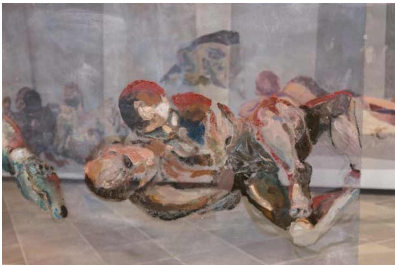
Figura 6. Detalhe da obra Paisagem , 2025, de Celaine Refosco.

camadas de transparência (Figura 6). Suas profundidades sugerem relevos que se completam com a presença dos visitantes, quando caminham por entre a instalação labiríntica e passam a integrar essa coletividade.