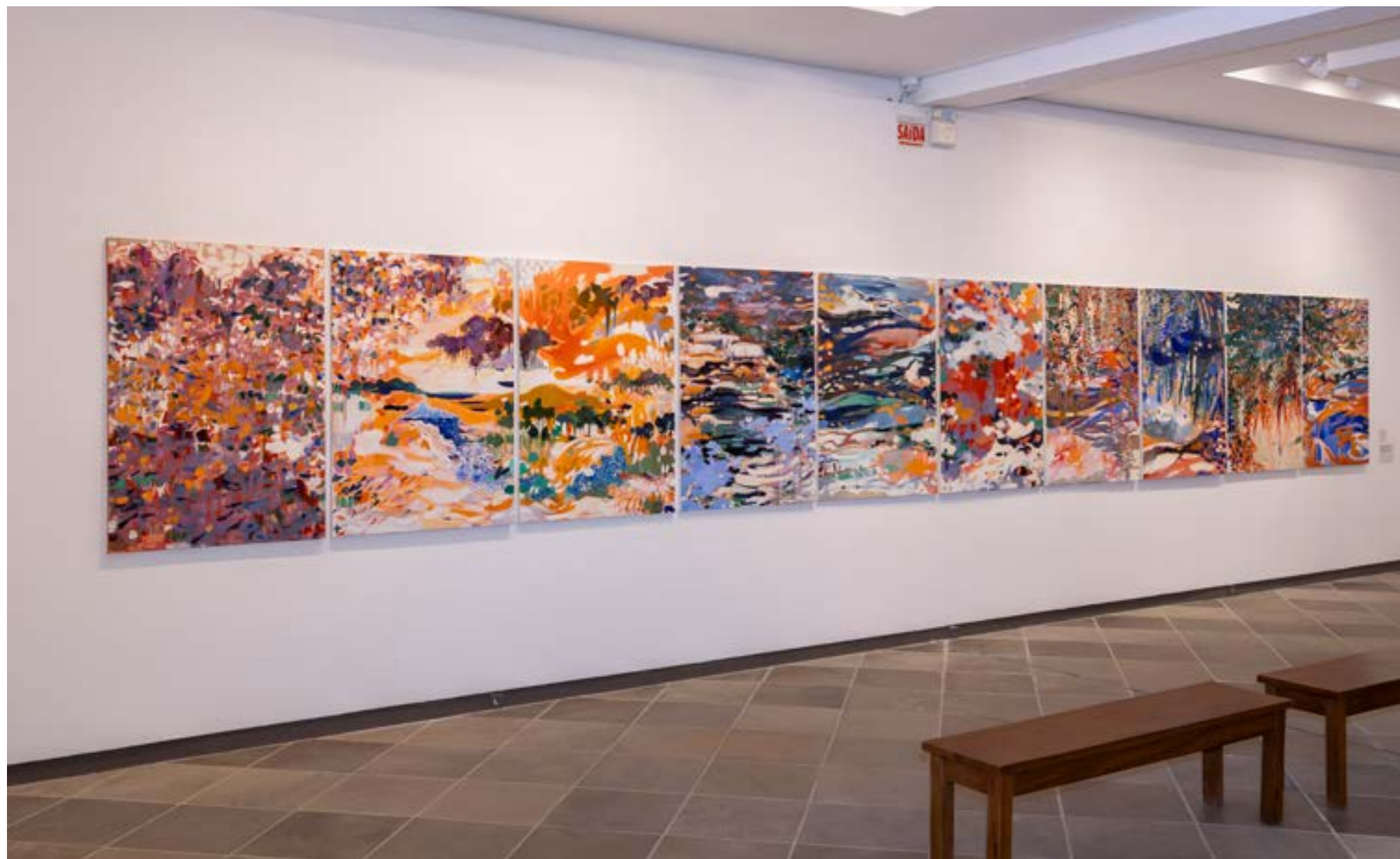
Figura 4. Rios voadores - Forças , 2025, de Celaine Refosco. Óleo sobre tela, 90 x 130 cm cada. Fonte: Acervo da Galeria Mamute. Crédito: Soninha Vill