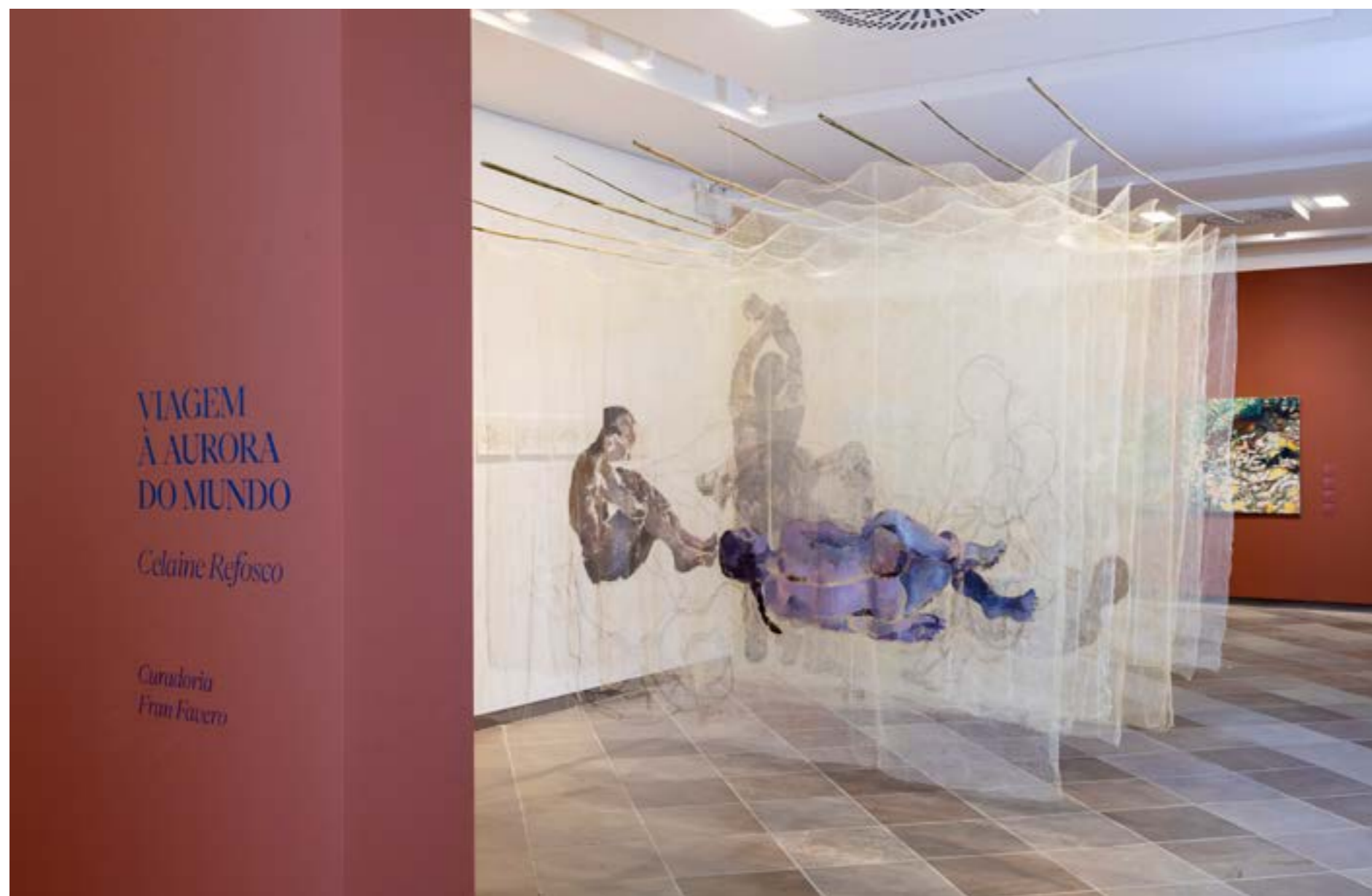
Figura 1. Vista geral da exposição “Viagem à Aurora do Mundo”, individual de Celaine Refosco, no Museu de Arte de Santa Catarina.