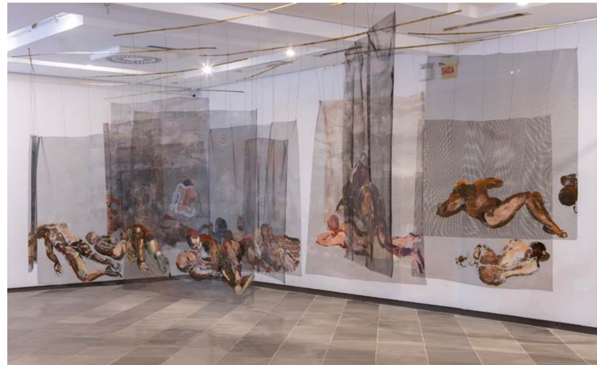
Figura 5. Paisagem , 2025, de Celaine Refosco. Óleo sobre 14 painéis de tela de poliamida, 170 x 150 cm cada.