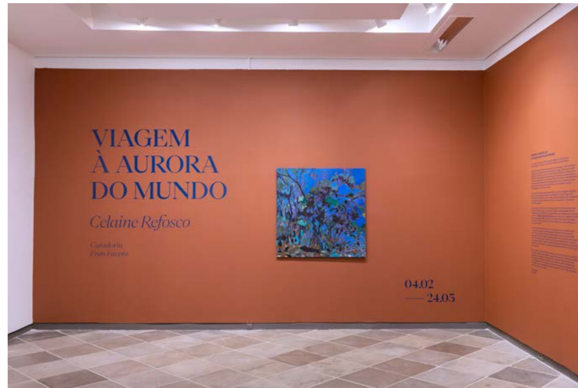
Figura 3. Vista da exposição “Viagem à Aurora do Mundo”, individual de Celaine Refosco, no MASC, sob curadoria de Franciele Favero.

As instalações pendentes intensificam o convite à imersão. Em Paisagem (2025) 3 , a tinta é aplicada sobre suportes de poliamida em malha aberta, parcialmente ocupados pelas pinturas de corpos deitados, prostrados (Figura 5). A artista evoca uma multidão de corpos sem desejo,