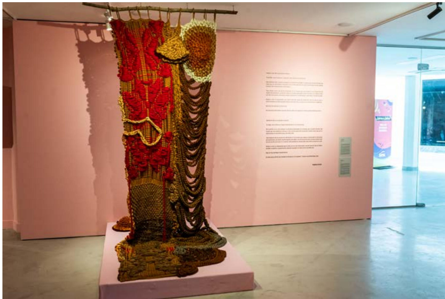
Figura 5: Obra da artista Angélica Serech, Habitar la Raiz , 2026, tear de cintura com técnica livre feita à mão, 52 x 96 x 220 cm.

constroem uma cartografia íntima na qual território, lembrança e ancestralidade se entrelaçam. Mayara Veloso apresenta uma escultura de tramas e fios que coloca a natureza como espaço a ser habitado. O têxtil torna-se uma geografia feita à mão; nela, território e experiência se entrelaçam em um ciclo contínuo de nascimento e retorno.