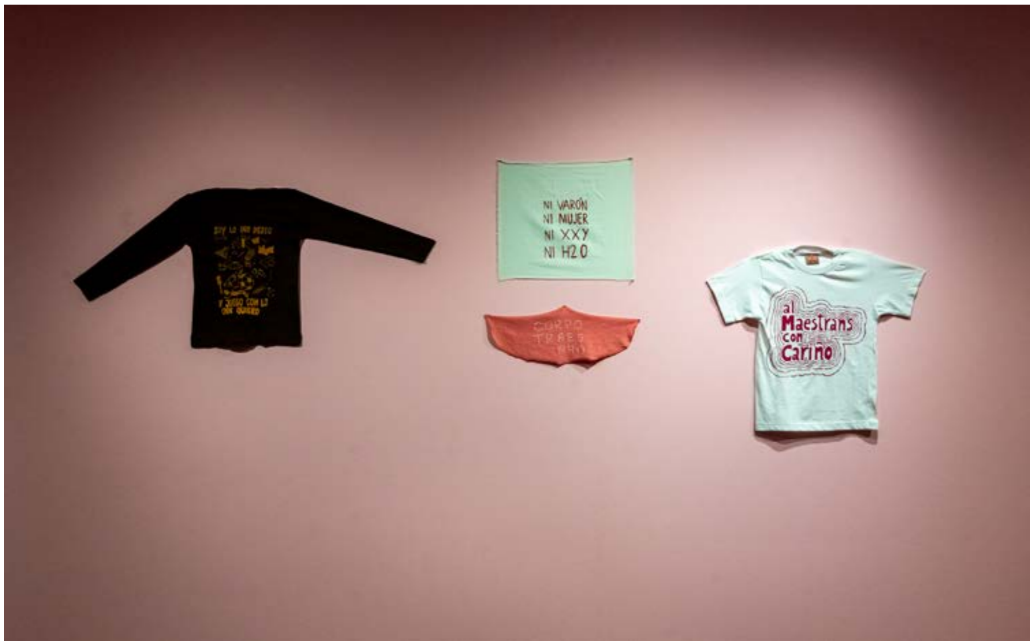
Figura 3: Série de obras do coletivo Serigrafistas Queer. Sem título , 2025, serigrafia sobre tecido, dimensões variáveis.

figurativos funcionam como relatos visuais de deslocamento, perda e luta por direitos, estabelecendo uma genealogia de pensamento, território e fazer manual. Já as Serigrafistas Queer apresentam um conjunto vivo de tecidos que registram quase duas décadas de produção coletiva ligada a pautas dissidentes de gênero, corpo e política. A serigrafia opera como mobilização de ideias e construção ativista.