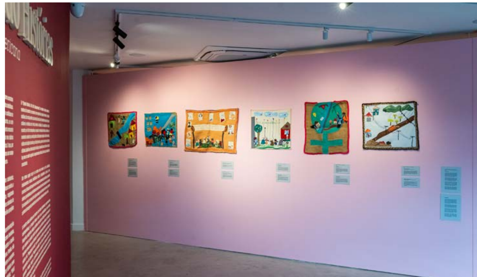
Figura 2: Série de obras do coletivo Mulheres Atingidas por Barragens. Mulheres Atingidas por Barragens em Luta , 2023/24, bordado a mão sobre tecido, 30 x 42 cm. Direitos Já! , 2024, bordado a mão sobre tecido e juta, 58 x 51 cm. Luta e Resistência , 2023/24, bordado a mão sobre tecido, 32 x 42 cm. Sem título , 2023/24, bordado a mão sobre tecido, 32 x 42 cm. Tratores Famintos , 2024, bordado a mão sobre tecido, 45 x 54 cm. Sem título , 2023/24, bordado a mão sobre tecido, 32 x 42 cm.

O coletivo Mulheres Atingidas por Barragens, vinculado ao Movimento dos Atingidos por Barragens (MAB), recupera a tradição latino-americana das arpilleras para narrar, em tecido, as consequências ambientais e sociais provocadas por grandes empreendimentos. Seus bordados