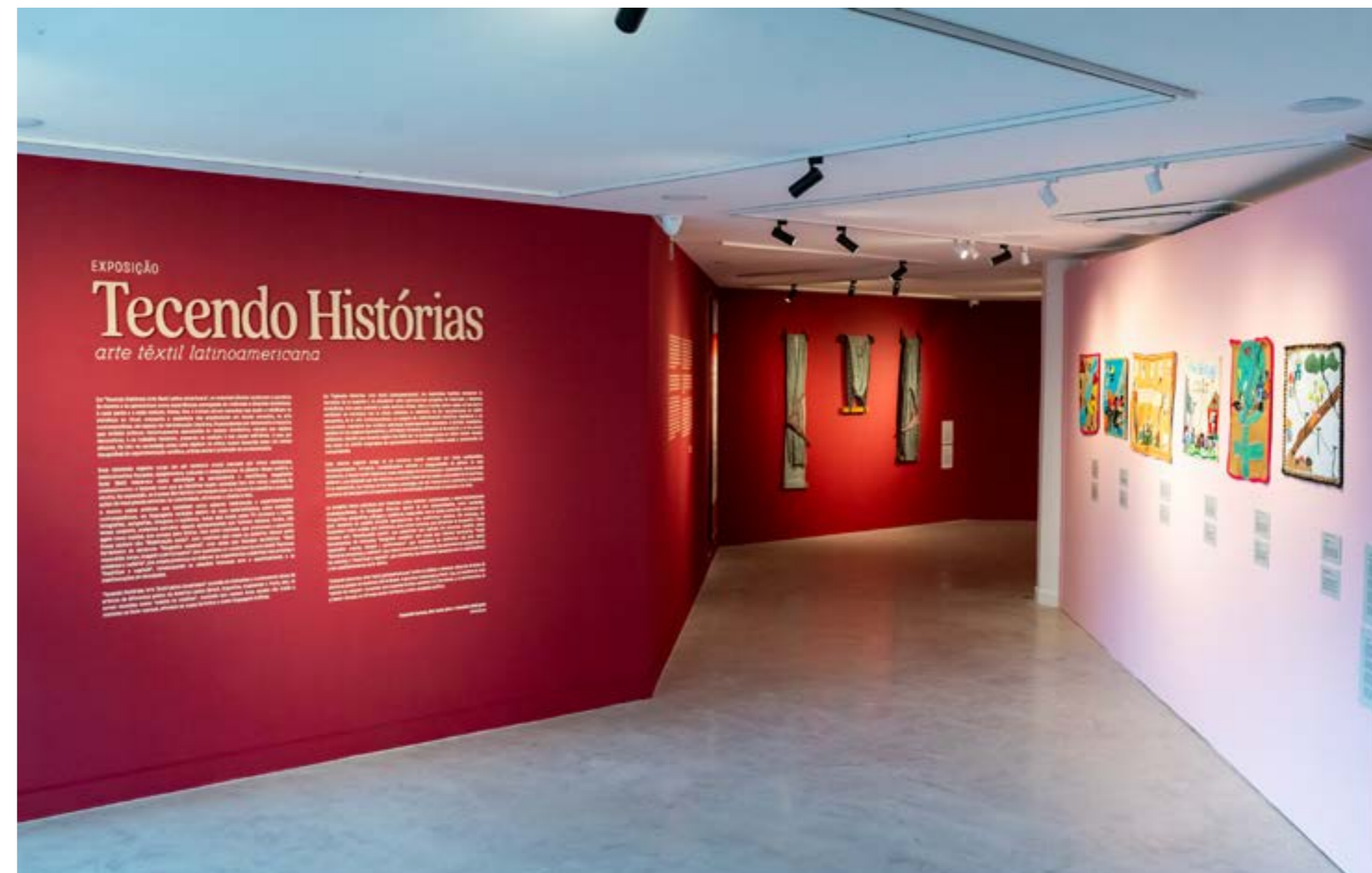
Figura 1: Vista geral da exposição “Tecendo Histórias: Arte Têxtil Latino-Americana”, SESC Tijuca, Rio de Janeiro, 2026.

Essa retomada emerge em um contexto social marcado por crises ambientais, deslocamentos forçados,