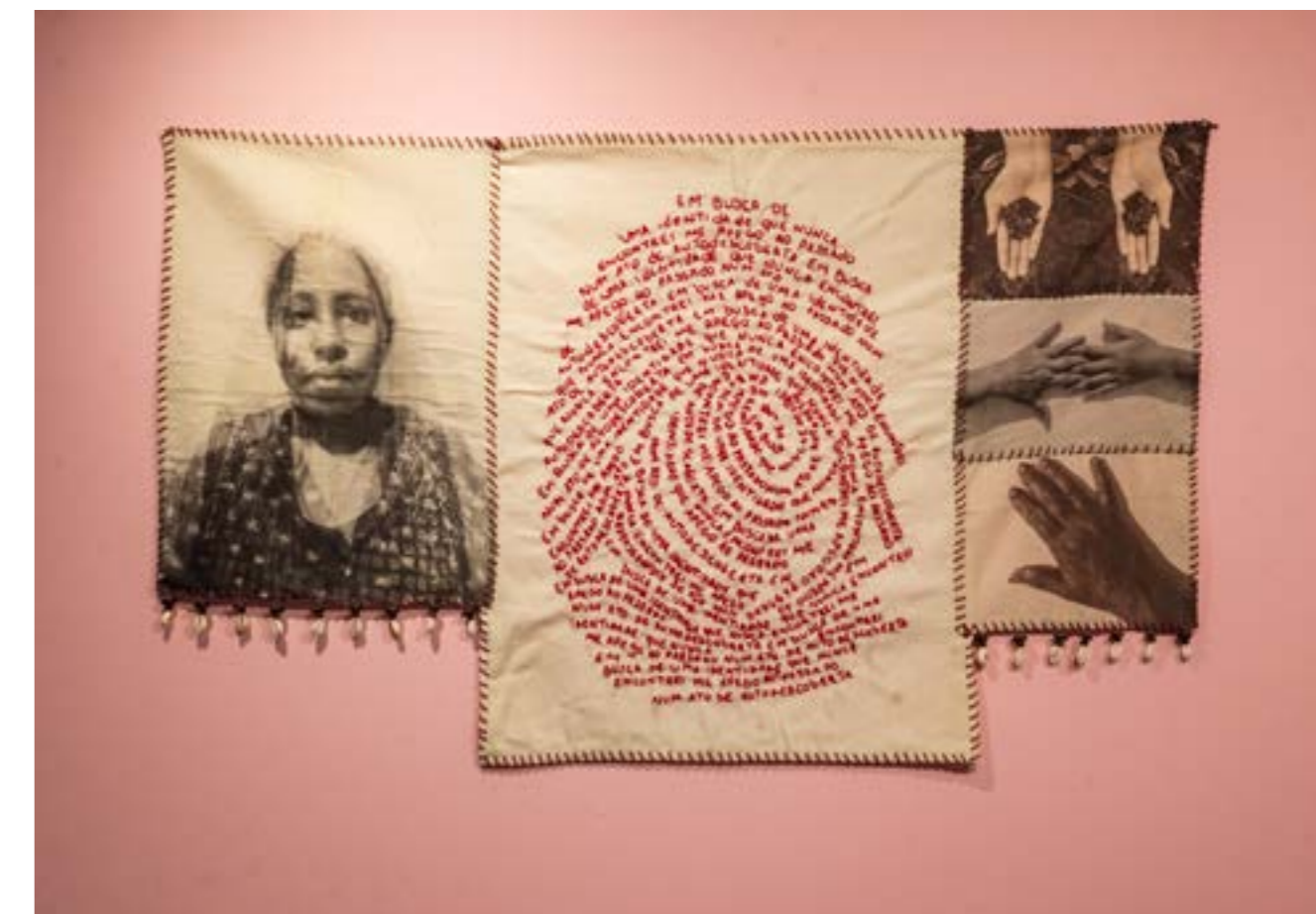
Figura 8: Obra da artista Karine de Souza, Em busca de uma identidade que nunca encontrei me apego ao passado num ato de autodescoberta , 2023. Bordado, fotografias impressas em algodão cru, búzios e miçangas amadeiradas, 58 x 107 cm.

del Guairá, Paraguai, berço da tecelagem do Ao po'i, como também reúne histórias ao desenvolver processos de vivência, escuta e criação coletiva com a comunidade.