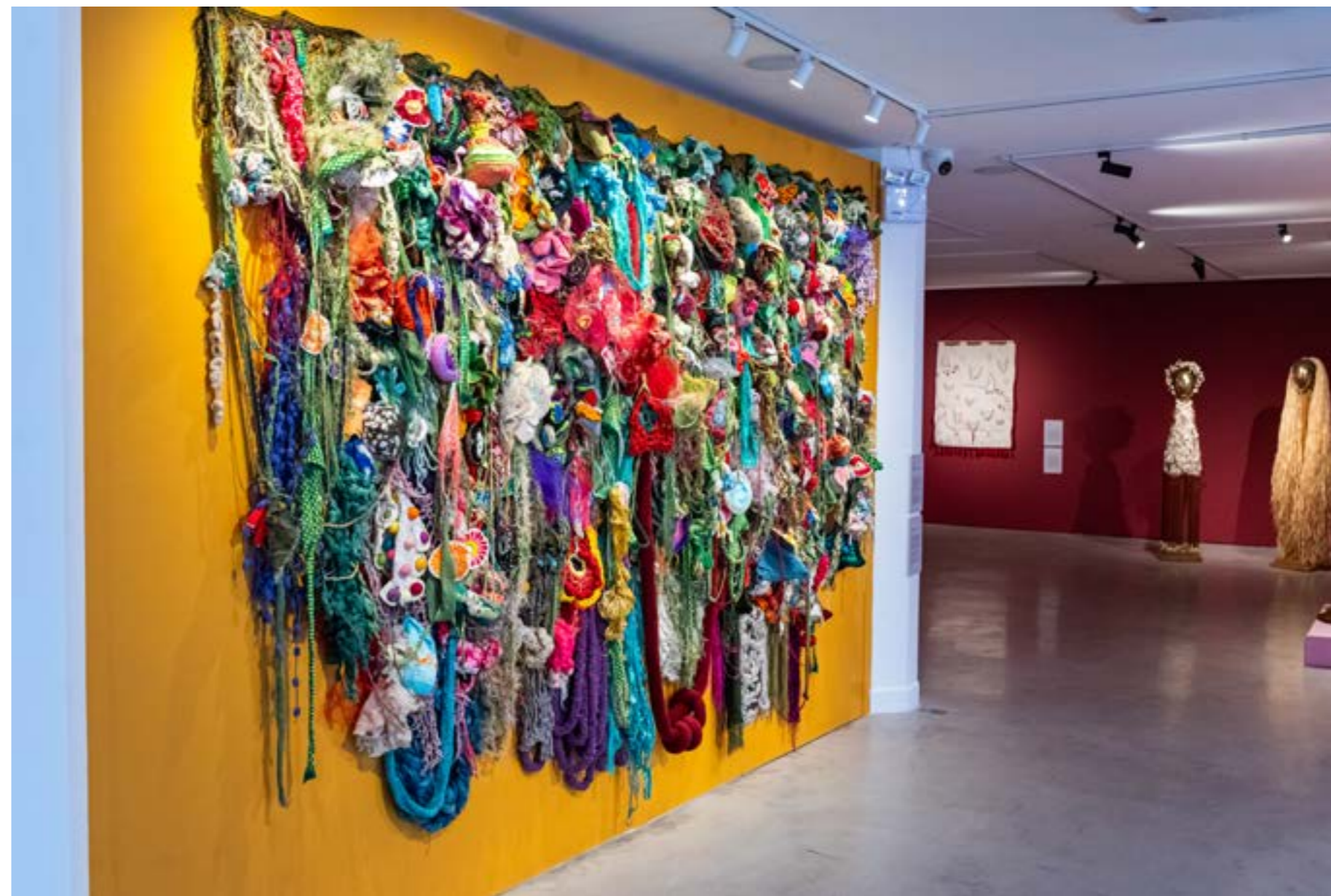
Figura 13: Obra da artista Claudia Lara, Jardim Ancestral , 2023. Instalação têxtil com rede, lãs, fios diversos, aplicação de bordado, feltragem, crochê e tricô, 300 x 200 x 20 cm.

memória continuam a se entrelaçar. Talvez seja justamente aí que resida a força do têxtil: na sua capacidade de manter vivos os vínculos entre passado e presente, entre o íntimo e o político, entre aquilo que se tece individualmente e aquilo que só pode existir no coletivo.