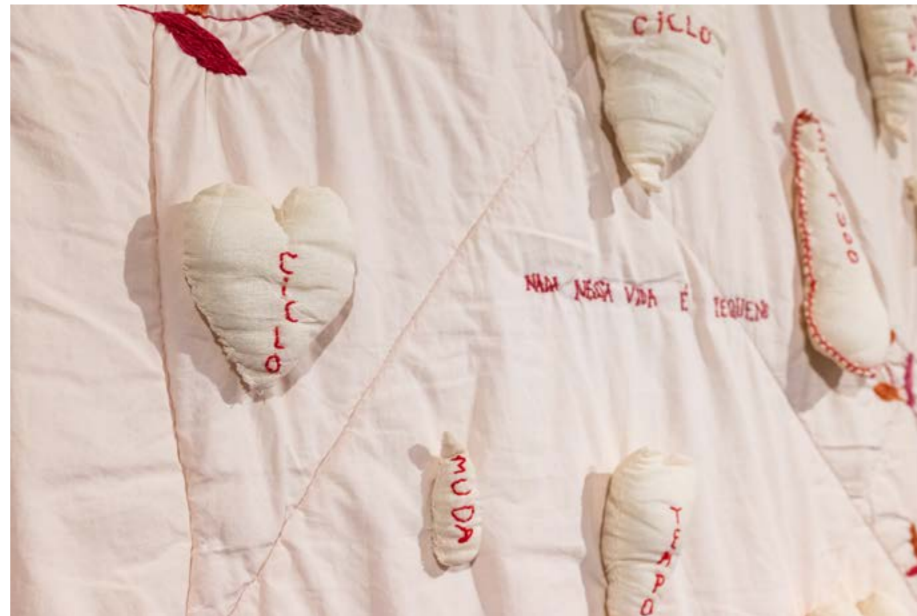
Figura 12: Obra da artista Cláu Epiphanio, Edredom , 2024. Recorte de edredom bordado com aplicação de almofadas de algodão com enchimento, 100 x 82 cm.