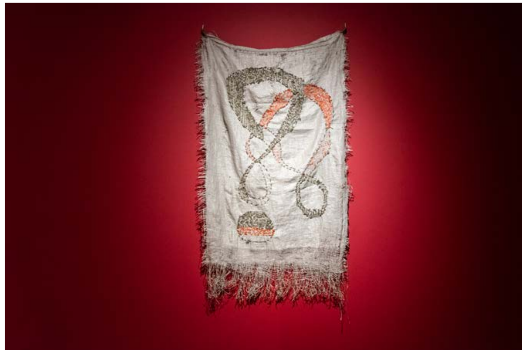
Figura 7: Obra da artista Iahra, Klein , 2025, bordado em ráfia, linha de lã e algodão, 80 x 30 cm.