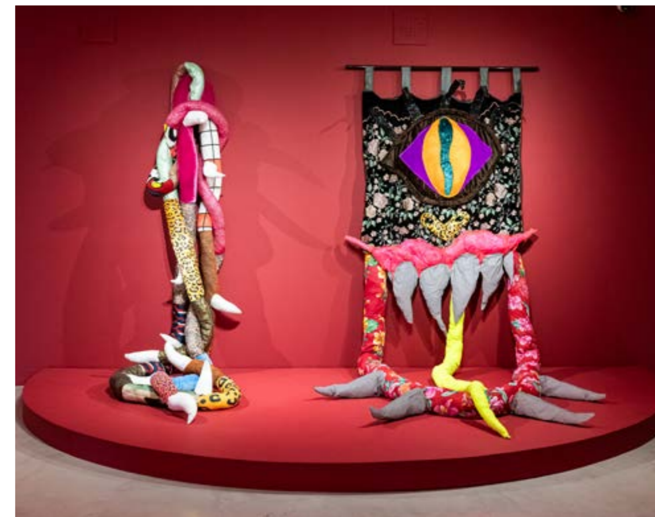
Figura 6: Obras da artista Rafa Bqueer, Natureza dentada , 2025, dimensões variáveis, e Mapingua-Trava , 2025, dimensões variáveis.

e desafiando as estéticas dos figurinos ao articulá-los como um ato performático.