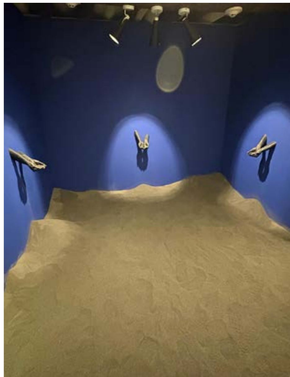
Sethembile Msezane (Sudáfrica). Fragmento de la instalación Guardianes de la tierra , 2025. Suelo volcánico, arena de solice, material de impresión 3D - Curaduría Amy Rosenblum-Martin (Estados Unidos).