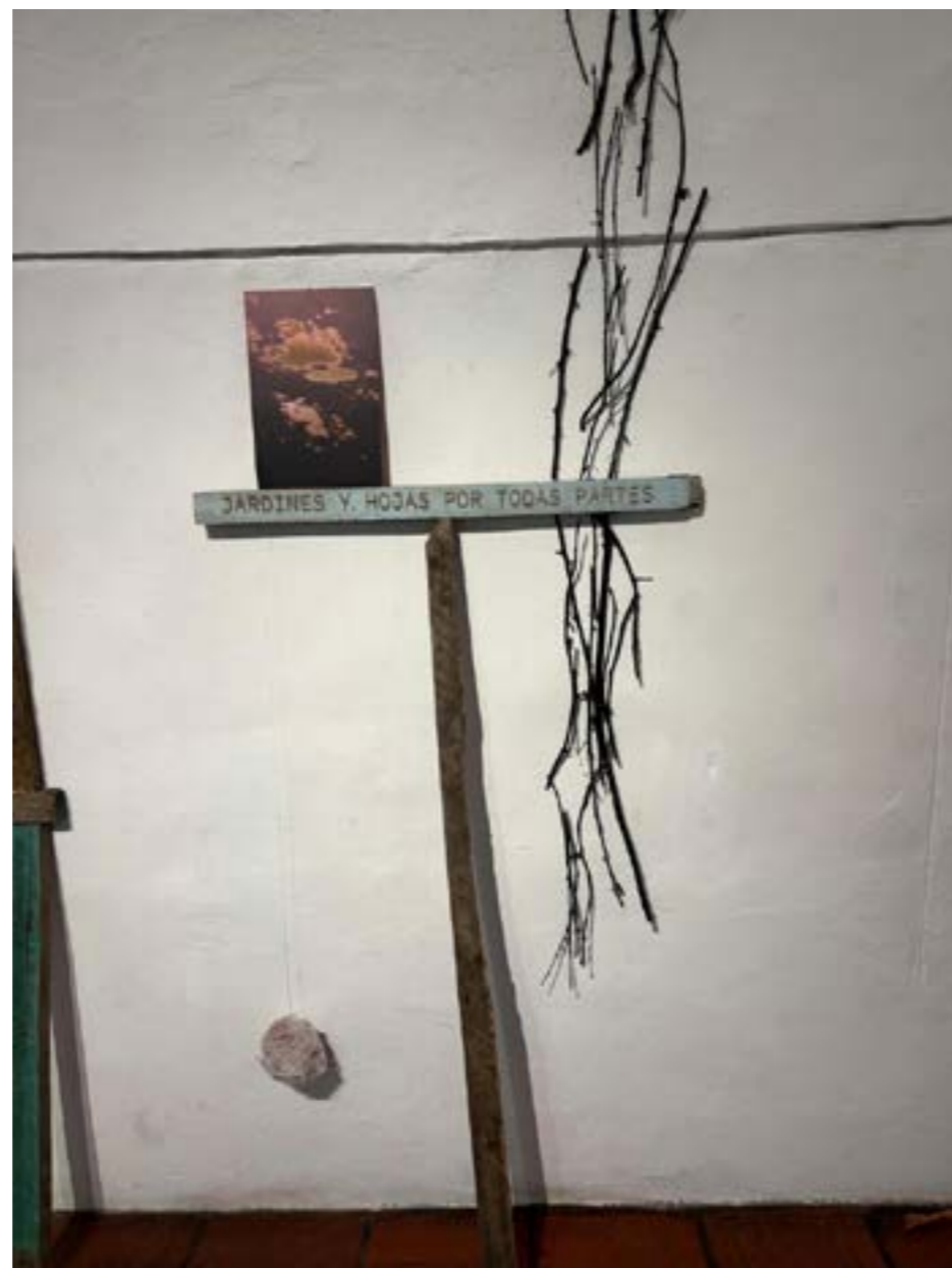
Fragmentos de la instalación Lo que esta escrito , 2025 de Oswaldo Ruiz - Curaduría Justo Pastor Mellado (Chile).

monjas con una obra titulada Piedralumbre .