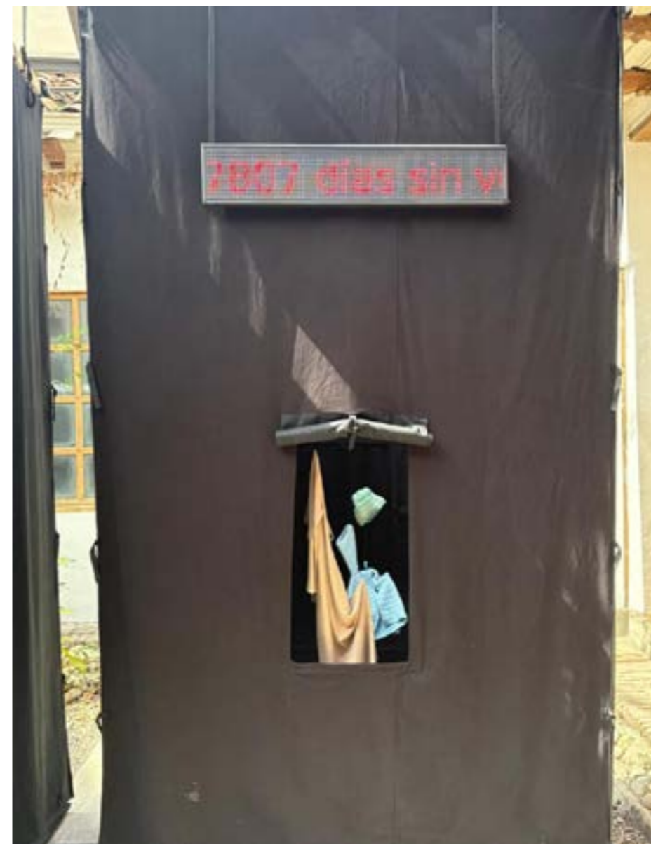
Fabián Nonino (Argentina). Fragmento del video instalación Tiemblo cuando veo una sombra que se le parece , 2025 - Curaduría Marcela Römer (Argentina).

Römer de esta manera traza un marco reflexivo donde la desaparición se extiende más allá del hecho físico: abarca la pérdida de sentido, la erosión del lenguaje, el colapso