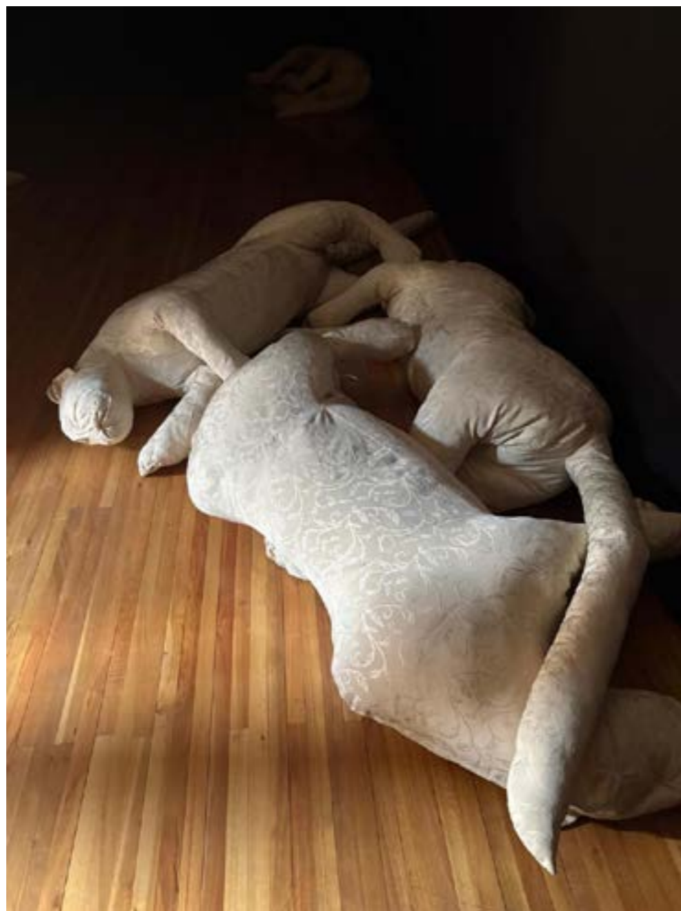
Fragmento de la instalación Topográficas de la incisión , 2025, de Mariela Leal, escultura blanda - Marcela Römer (Argentina).

de lo cotidiano. El texto reconoce al Covid-19 como un acontecimiento global que nos obligó a experimentar esa volatilidad, recordándonos que el arte no está fuera del mundo, sino dentro de su fragilidad.