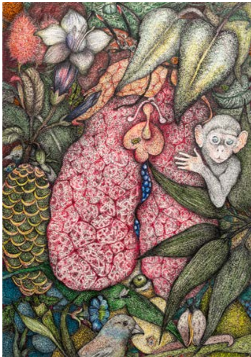
“Aristolchia Elegans”, Série “Livro Verde”, lápis aquarelável e nanquim sobre papel algodão, 40 x 30 cm, 2024, Michel Zózimo.

Através de sua obsessiva e insaciável pesquisa de imagens, o artista idealiza um profícuo futuro e uma nova vida para elas. Rejeita qualquer descarte e os anunciados esquecimentos. Ele cria, frente a esses desenhos, uma outra memória, distanciada das crenças apocalípticas que se alastram pelo mundo e propõe uma fecunda vida ficcional para elas por meio da sua arte, em meio às conformações intrincadas e labirínticas de seus contornos. Algumas jazem umas sobre as outras, às vezes sutilmente escondidas ou retorcidas em meio aos desenhos. Aglutinam-se neles todos os seres, os da fauna, da flora e humanos, ao simularem seu incessante trânsito através dos espaços, em sua ameaça de explodi-los. Mesmo que por suas diferentes naturezas, formam eles, em seu conjunto, uma única mescla viva, aquela que na ficção do artista constrói o mundo. “A natureza vai tomando conta do observador, mas ela jamais irá acabar”, revela Michel, convicto de sua preservação. Podem mesmo, em sua ficção, transbordar para fora das obras, para além dos limites artísticos, porém jamais virá a ser destruída.