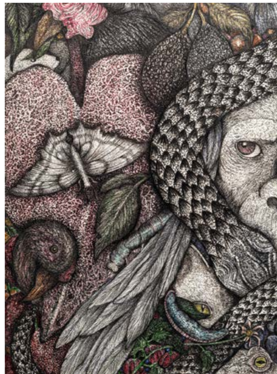
“Notívagos, gorila com mamba negra”, Série “Livro Verde”, lápis aquarelável e nanquim sobre papel algodão, 40 x 30 cm, 2024, Michel Zózimo.

Na construção obsessiva e ininterrupta dos trabalhos artísticos de Michel, por um lado a partir de imagens extraídas do âmago de preciosas enciclopédias, ora de ciências, biologia, das ciências naturais, também de livros de ficção científica e da natureza - por outro, desde inúmeros catálogos de arte, estes oriundos de coleções de museus ao redor do globo, assim como do