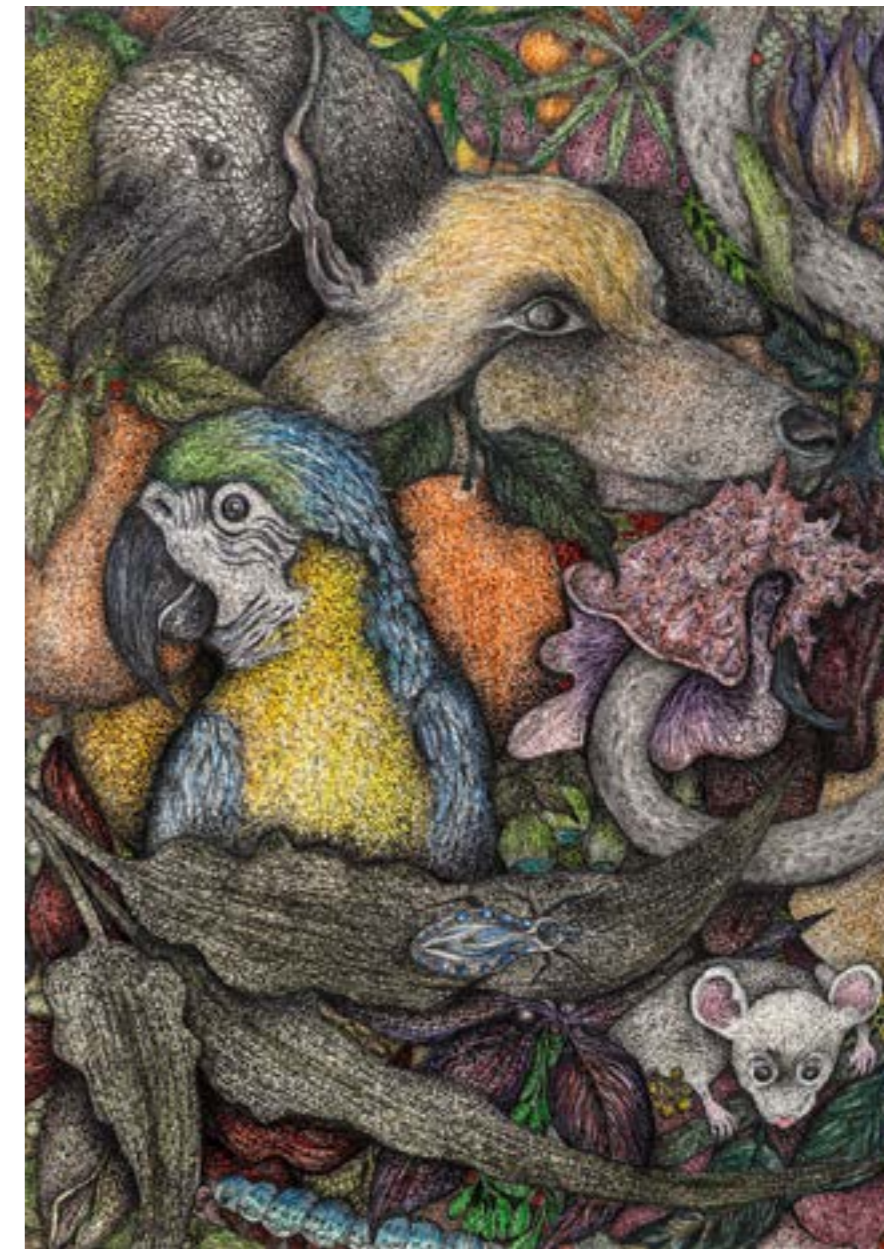
“Guará”, Série “Livro Verde”, lápis aquarelável e nanquim sobre papel algodão, 40 x 30 cm, 2024, Michel Zózimo.

Zózimo revive esses princípios da arte de outrora, no que contrastam com a desilusão do presente. Sente, pelo ato inventivo, a vida fluir, entre as ambiências e as imagens que cria por meio das suas ficções, ao constituírem elas uma sempre inovadora memória do mundo. Estas constituem uma experiência de natureza estética, pois o dispositivo ficcional e prazeroso ocorre por autoestimulações imaginativas, isto é, cria e forma as imagens. 1 Neste processo, Michel considera a imaginação o cerne fundamental dos seus trabalhos ficcionais, um modo de respirar em meio às atmosferas densas do mundo, onde é expressa sua força vital. Ela opera nos trabalhos ao dar forma aos seus desejos, algo que se constrói,