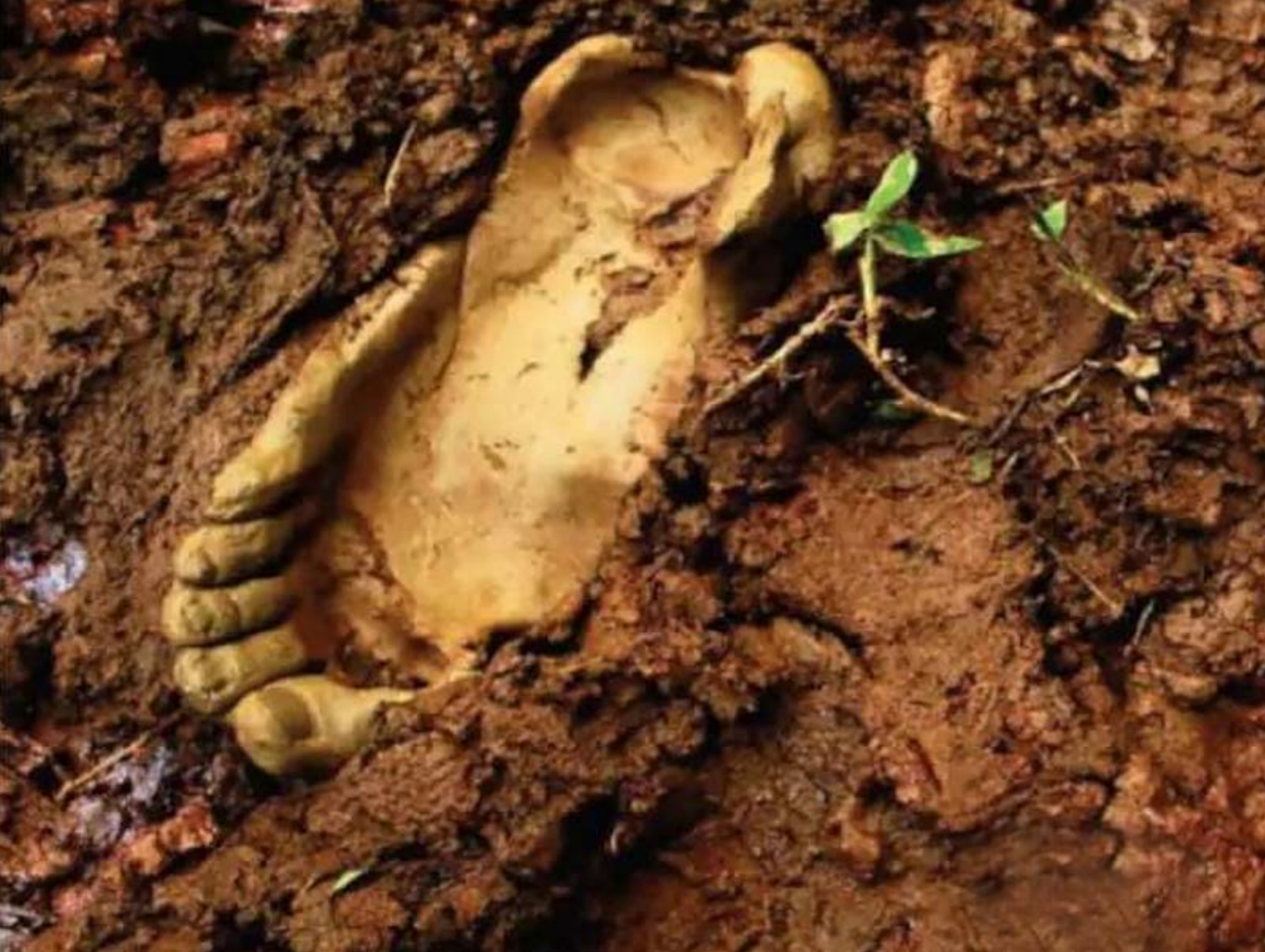
Imagem da capa do livro de Gil Vieira Costa, Mezanino Editorial, 2024