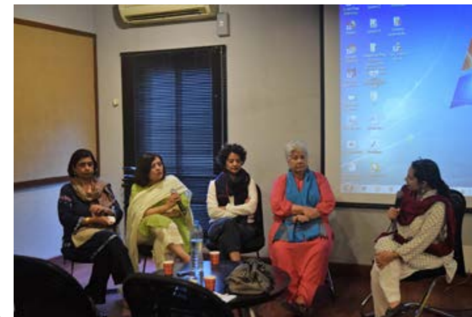
Fig. 4: Second KB .