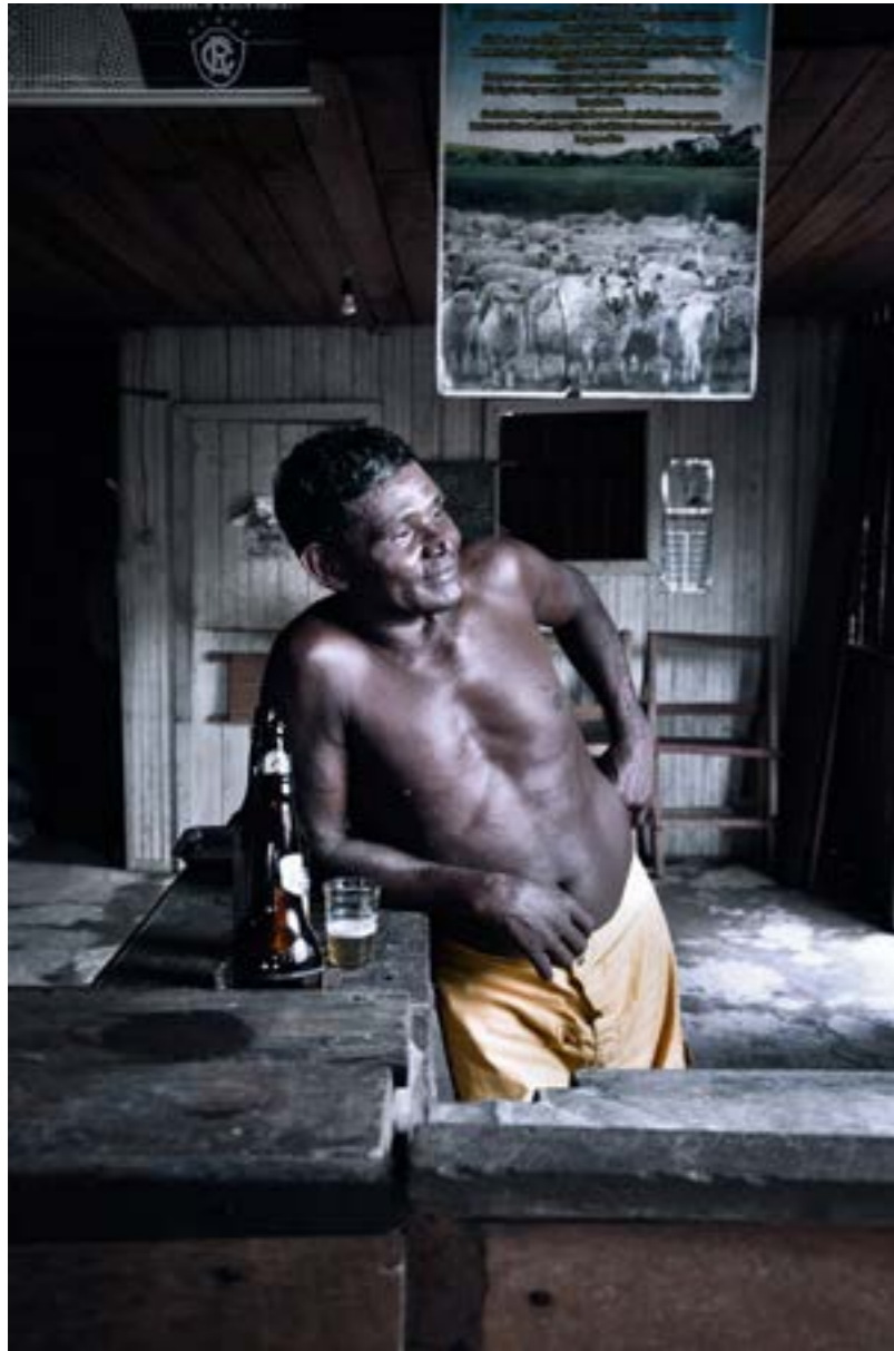
Fig. 2: Bairro do Jurunas, Belém-PA. Foto: Cyro Almeida, 2017.

Porém, para um público com algum conhecimento sobre a fotografia contemporânea em Belém, essas convergências entre as obras de Cyro Almeida e as de Luiz Braga são percebidas sem muito esforço. Isto é o que as obras nos dão se nos aproximarmos delas em busca de uma interpretação esteticista, preocupada sobretudo com as aparências e superfícies. É preciso ir além.