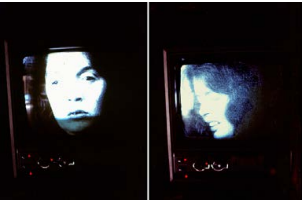
Fig. 2: Miedo.

Nesse trajeto de Vater vale a menção à poética de Oiticica. Na produção do artista, o uso da cultura popular se dá como matéria-prima para a criação, assim como para a potencialidade experimental e desafio aos cânones estéticos. Igualmente, Vater aprofunda-se nas narrativas indígenas e demais simbolismos de uma identidade brasileira original, mas pontuada por referências femininas. Atraída pelos aspectos místicos, interessa-lhe a mitologia e a capacidade plástica