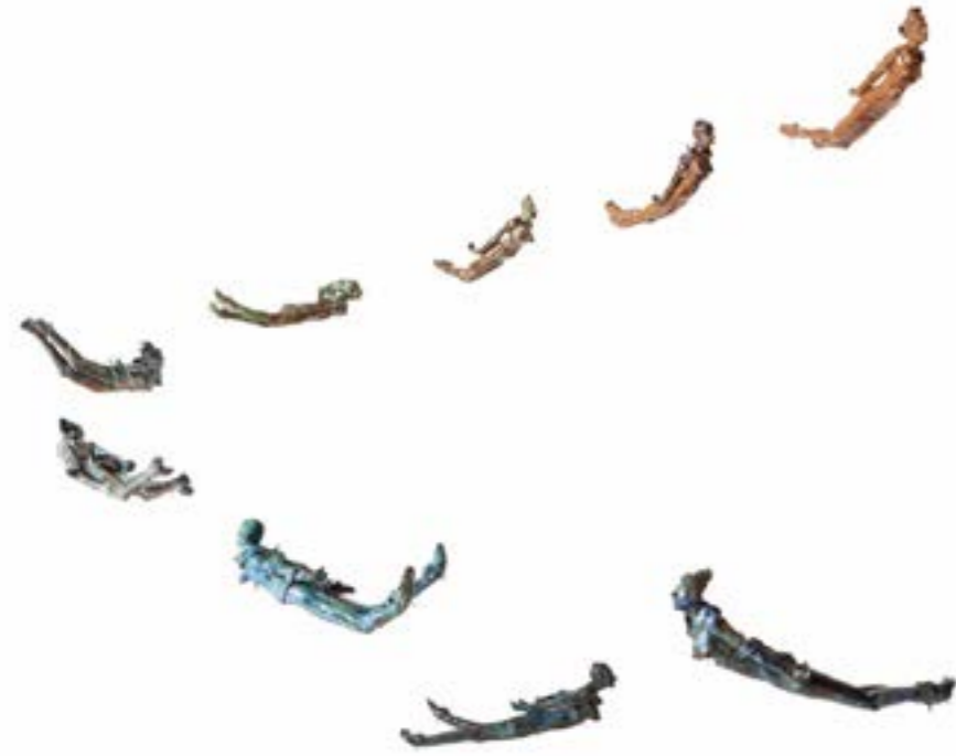
Fig 2:

Cristina materializou suas ninfas como NEPHELE, por ser uma ninfa das nuvens. NEPHELE também é o nome de uma espécie de mariposa, atraída pela luz. Diz que quando desejou fazer essas imagens, não pensou objetivamente em nada, apenas as via dançando em sua frente. O que vemos é a objetivação de uma subjetividade. Completando seu pensamento, expressou que “as nuvens estão constantemente presentes em nossas vidas, são imperceptíveis na maioria das vezes, mas presentes. Como as figuras de ninfa, balançam lentamente, cada uma no seu ritmo, em todas as direções. Dançam, como um ballet coreografado pela natureza. Não se deixam abalar. Carregam emoções do mundo, e por vezes são tantas, que precisam num ato de fúria serem esvaziadas, para começarem tudo de novo” . A imagem da ninfa revela-se na sua permanente e obsessiva presença em vários estudos, autores, artistas. A ninfa, imagem-sintoma que sobrevive e retorna, do mundo