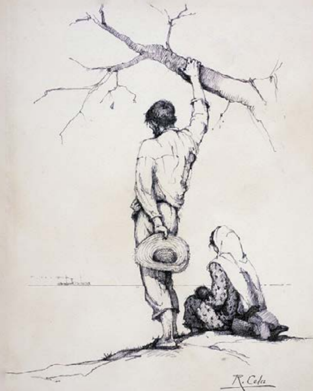
Fig. 01: Retirantes, de Raimundo Cella.