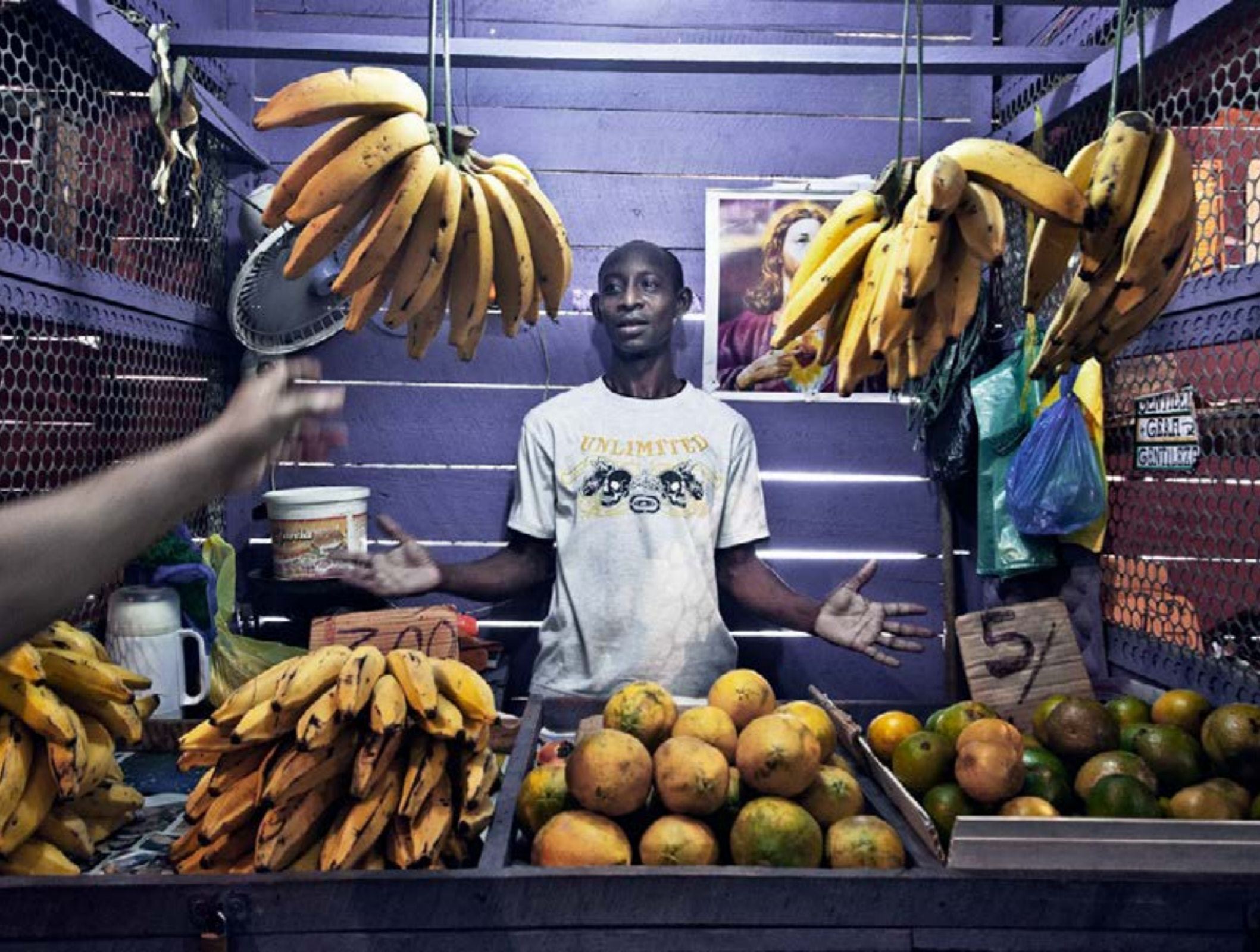
Fig 1: Feira do Guamá, Belém-PA.