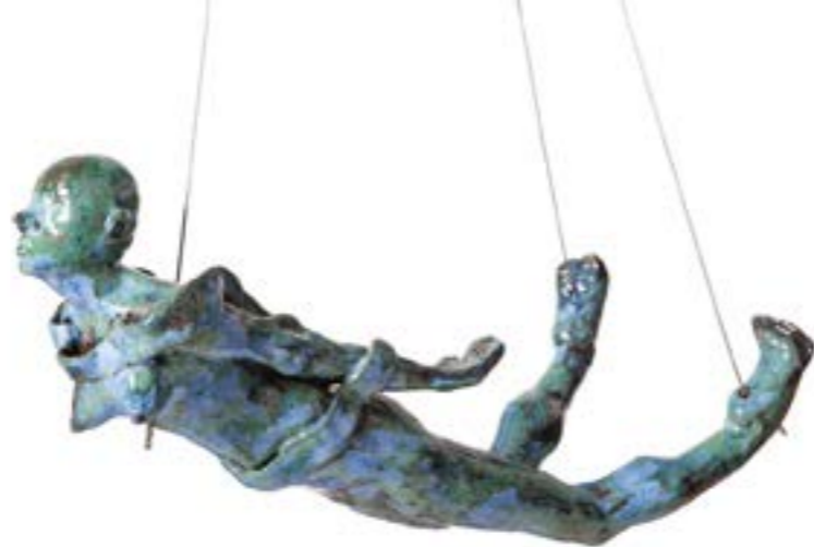
Fig 3:

seu permanente movimento de abrir e fechar de sentidos, “a tentação e a aporia de um saber exaustivo sobre essas coisas frágeis e proliferantes que são as imagens e as mariposas” (2007, p. 10-11). Reconhecemos a força disseminativa da ninfa que permite que seja encontrada em toda parte num “jogo de transformações e metamorfoses” e que resiste a qualquer procedimento que intente atribuir-lhe um significado determinado. “O caminhar da ninfa convida, então, a não deixar estancar a imagem, mas sempre mantê-la em movimento” (WEDEKIN, 2018). Ler os clássicos é também excelente complemento. Como diz Agamben (2012, p.29), “Nenhuma das imagens é original, nenhuma é simplesmente uma cópia. Nesse sentido, a ninfa não é uma matéria passional à qual o artista deve dar nova forma, nem um molde ao qual deve submeter seus materiais emotivos. A ninfa é um composto indiscernível de originalidade e repetição, forma e matéria. Porém um ser cuja forma coincide pontualmente com a matéria e cuja origem é indiscernível do seu vir a ser é o que chamamos tempo [...]”.