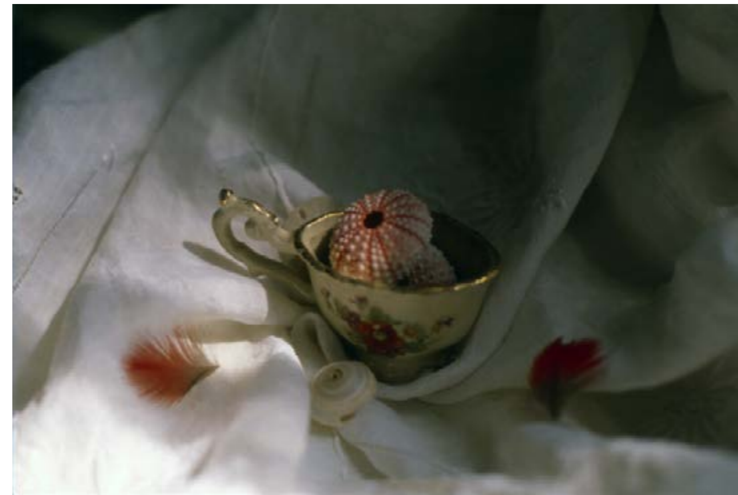
Fig. 3: Natures Mortes.

Já na arte contemporânea, a natureza-morta não perde de vista a oposição simbólica adjacente a esse gênero: morte e vida. Em Nature-Morte , Vater faz uso de vocabulário formal da pintura acadêmica, a partir de símbolos cosmogônicos da Umbanda e do Candomblé. O próprio título da série