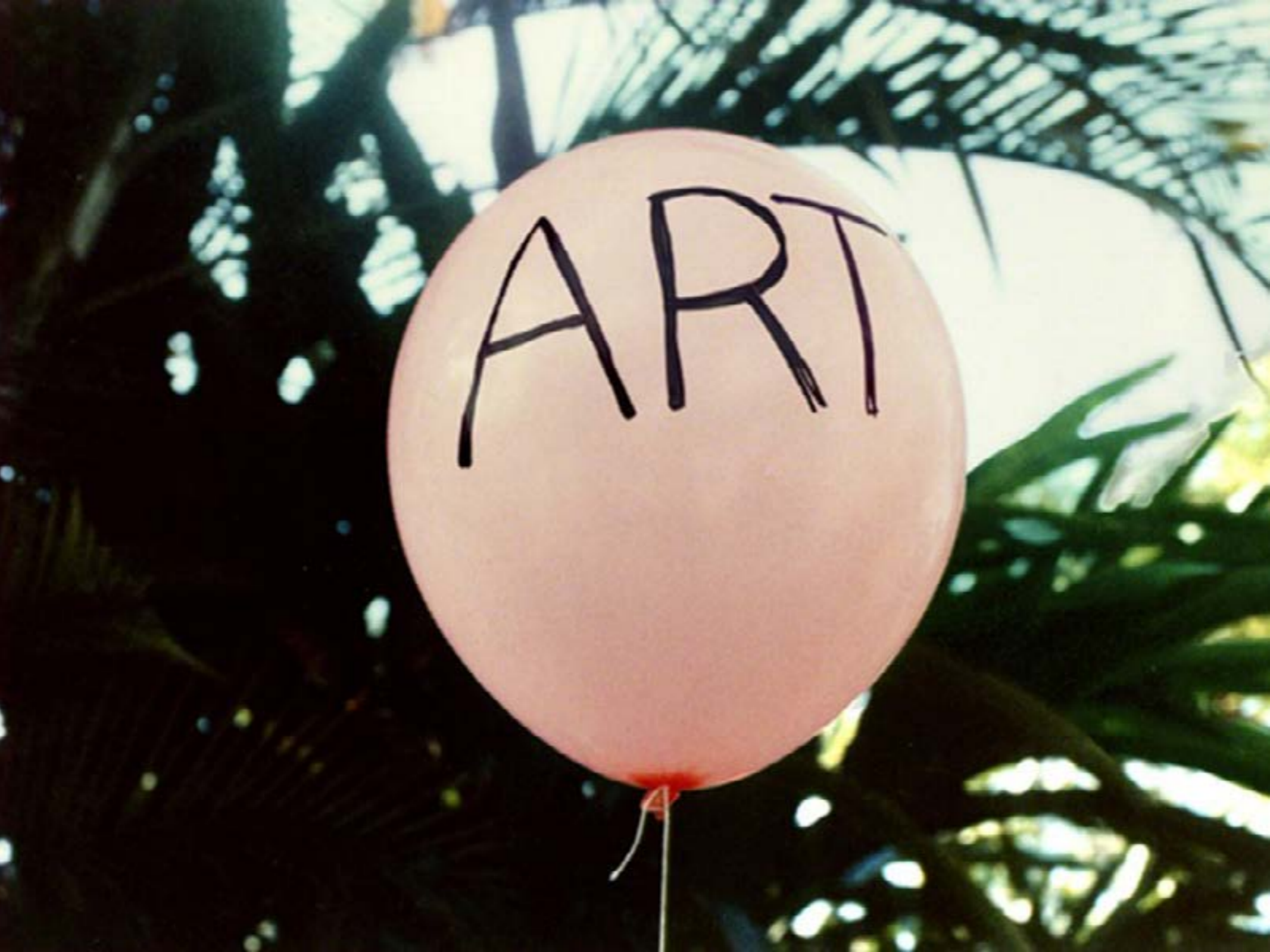
Fig. 1: Art.