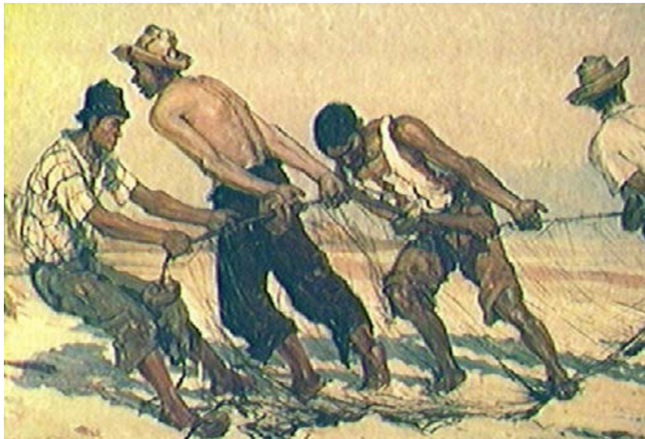
Fig. 2: Arrastão, de Raimundo Cella.

Eliseu Visconti, um admirador que o incentivava porque, entre outros méritos, Cella sempre obtinha o primeiro lugar. Na Poli, a mesma coisa. Parece demasiado? Não era. Ele ainda trabalhava e praticava esportes. Formou-se, com distinção, em ambas as faculdades, atuando como desenhista em emprego público (no qual ingressou por concurso) e remando nas poucas horas vagas.