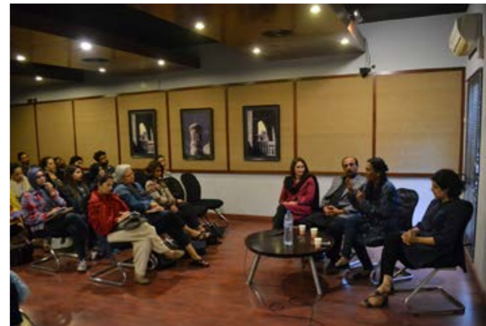
Fig. 3: First KB .