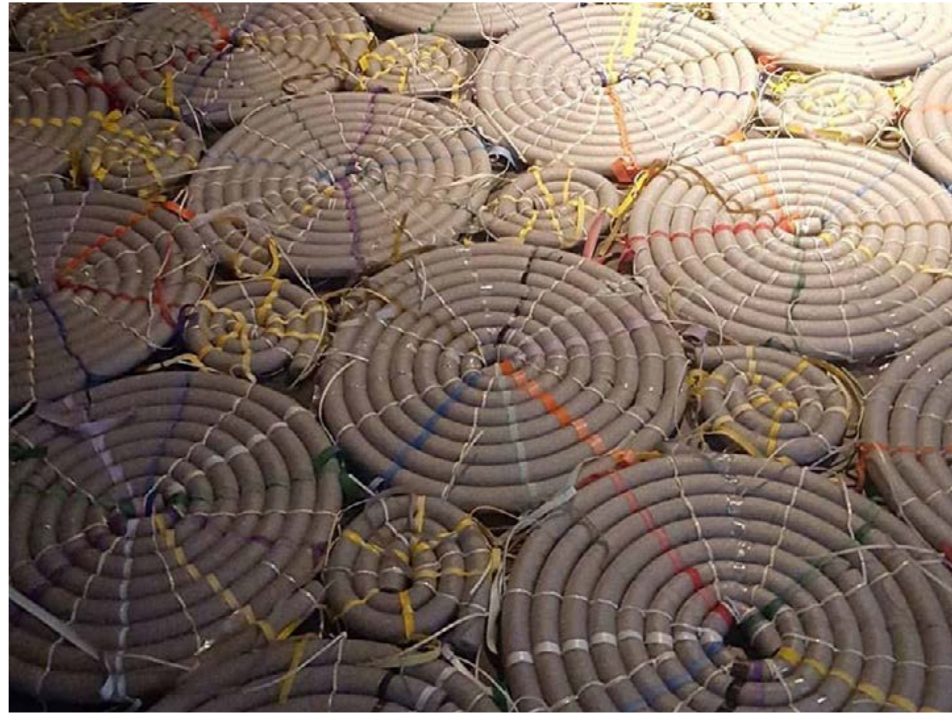
Fig. 5: Detalhe da obra Cem passos, sem sapatos, 2017.