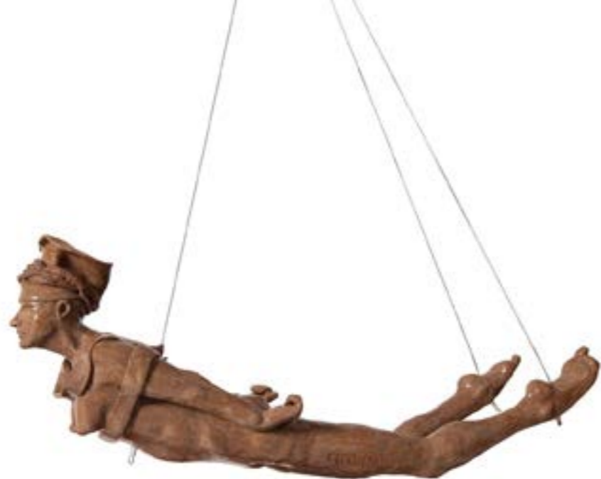
Fig. 1: Figura 9 da instalação. Cristina Brattig Almeida. NEPHELE ( FRAGILE). 2018. Escultura de cerâmica. Dimensões: cerca de 16 cm (largura) x 18 cm (altura) x 70 cm (comprimento). Peso cerca de 3,5 Kg.