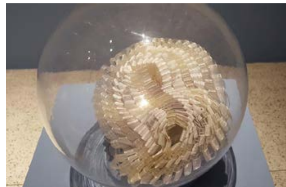
Fig. 3: Nuvens, 2017, Galeria de arte Espaço Universitário.

estruturante de outra relação: artista-obra-espectador. São 64 módulos de 45 cm de diâmetro e 56 módulos de 15 cm feitos de tubos isolantes em polipropileno na cor cinza, amarrados por fios de sisal e fitas das mais variadas cores e espessuras: restos da matéria-prima dos trabalhos da artista. São feixes enrolados em dois diferentes diâmetros e deixam-se formatar numa paisagem geométrica que se esparrama por quase toda a área de uma salinha anexa, propondo sentidos múltiplos. Assim, convida o público a caminhar e a ocupar o espaço.