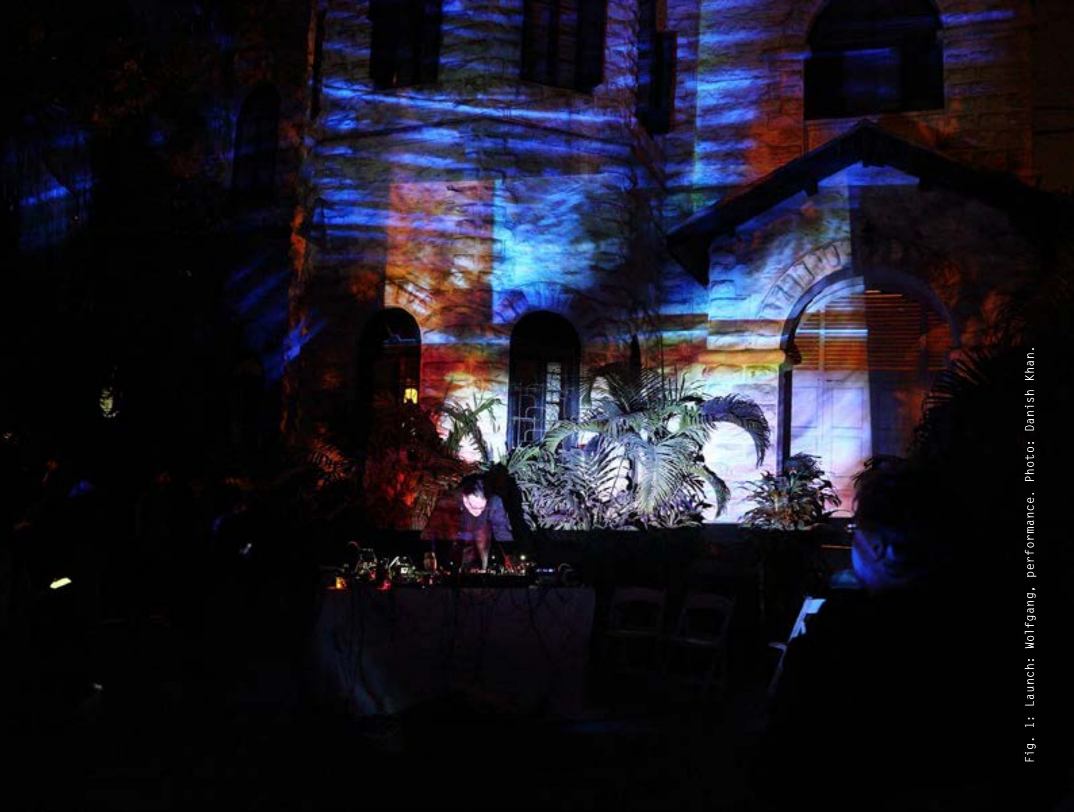
Fig. 1: Launch: Wolfgang, performance.