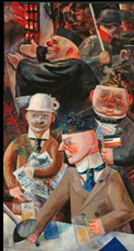
Fig. 1: George Grosz (1893-1959). Die Stützen der Gesellschaft [Os pilares da sociedade], 1926. Óleo sobre tela, 200 x 108 cm. Nationalgalerie, Berlim, Alemanha.