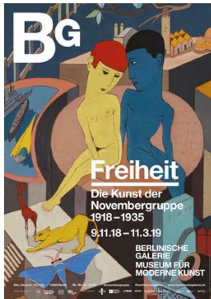
Fig. 2: Um dos cartazes de divulgação do evento, explorando detalhe da pintura Der Zaun (1928), de Hannah Höch.