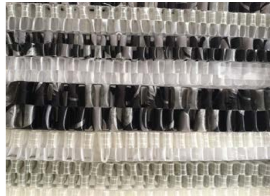
Fig. 2: Código de Barra, 2017.

Outro trabalho que ganha força em contexto arquitetônico é “Cem passos, sem sapatos”, sétima obra da artista,