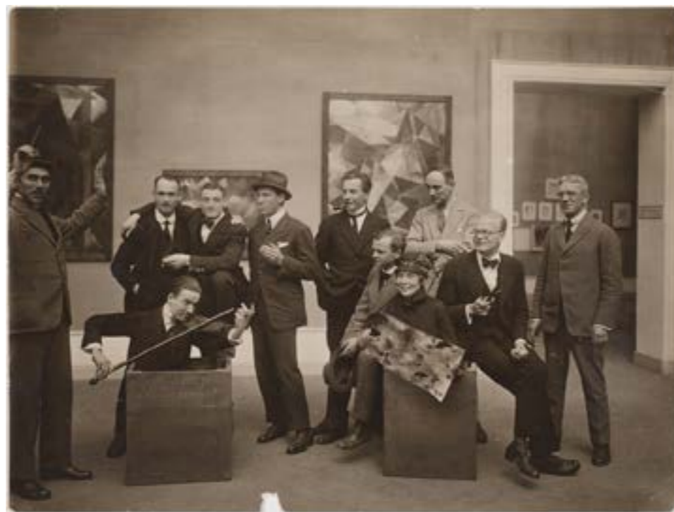
Fig. 5: Membros do Novembergruppe na exposição de arte de Berlim, 1920.

Crises internas e a ascensão do Partido Nacional-Socialista deram fim à democracia e, por extensão, à entidade. A maioria das obras expostas pelo grupo, ao longo dos anos, foi acusada de “degenerada”, e muitos dos artistas filiados chegaram a ser presos e enviados a campos de concentração, a exemplo do escultor Otto Freundlich, assassinado em 1943. Em seu esplendor e talvez mais ainda em seu crepúsculo, a experiência do Novembergruppe nos lembra de que a festejada liberdade é uma falácia quando a arte é cerceada.