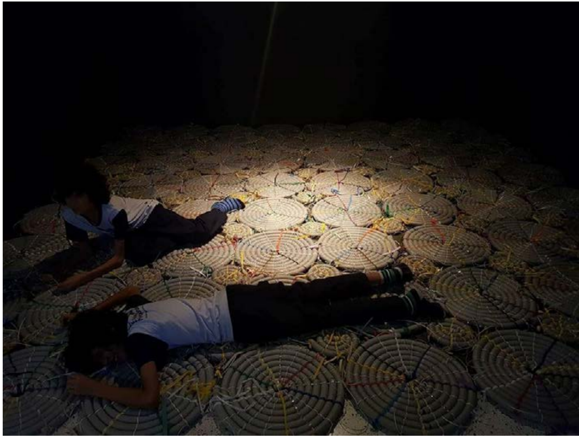
Fig. 4: Cem passos, sem sapatos, 2017.