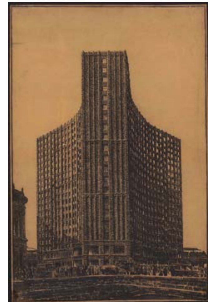
Fig. 6: Hans Poelzig (1869-1936). Hochhaus am Bahnhof Friedrichstraße [Arranha-céu na estação Friedrichstraße], 1921.