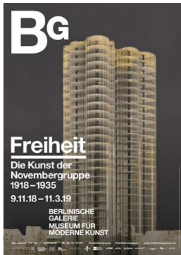
Fig. 3: Um dos cartazes de divulgação do evento, explorando imagem de projeto arquitetônico de Ludwig Mies van der Rohe (1922).

Mies van der Rohe, Paul Klee, László Moholy-Nagy, Eric Mendelsohn e Hannah Höch.