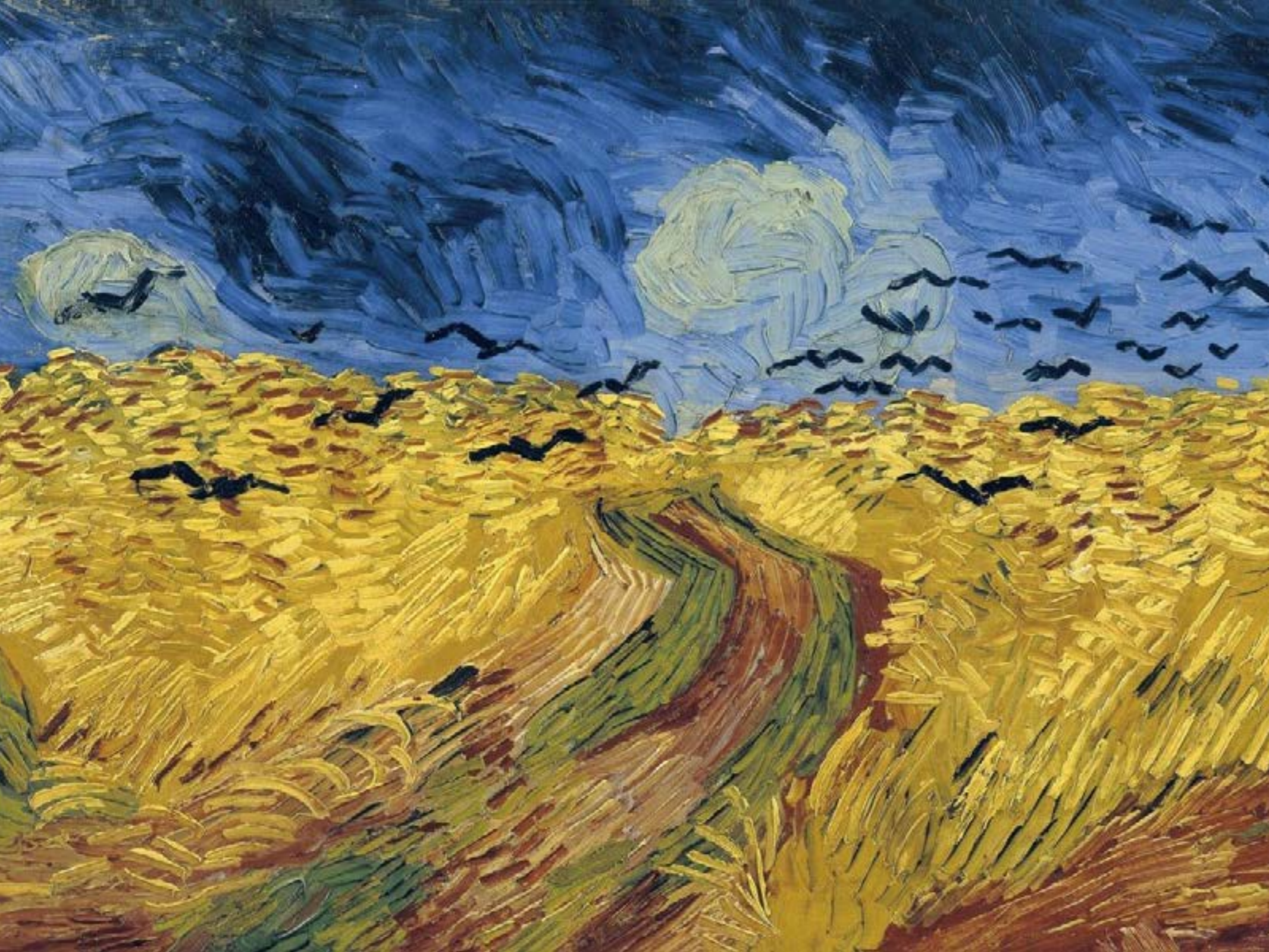
Fig. 1: Vincent Van Gogh, Campo de Trigo com Corvos, 1890, Museu Van Gogh, Amsterdã.