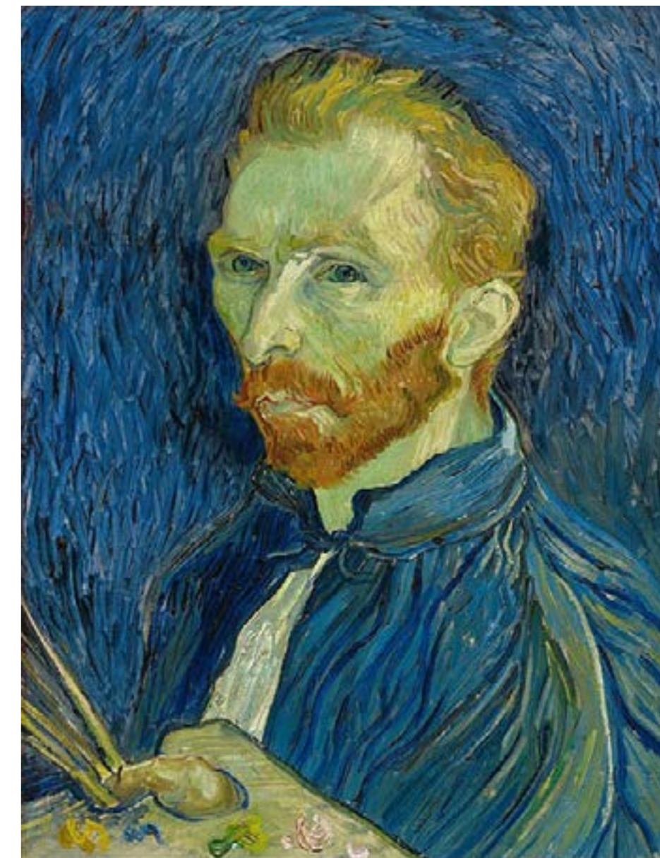
Fig. 2: Vincent Van Gogh, Autorretrato (1889).