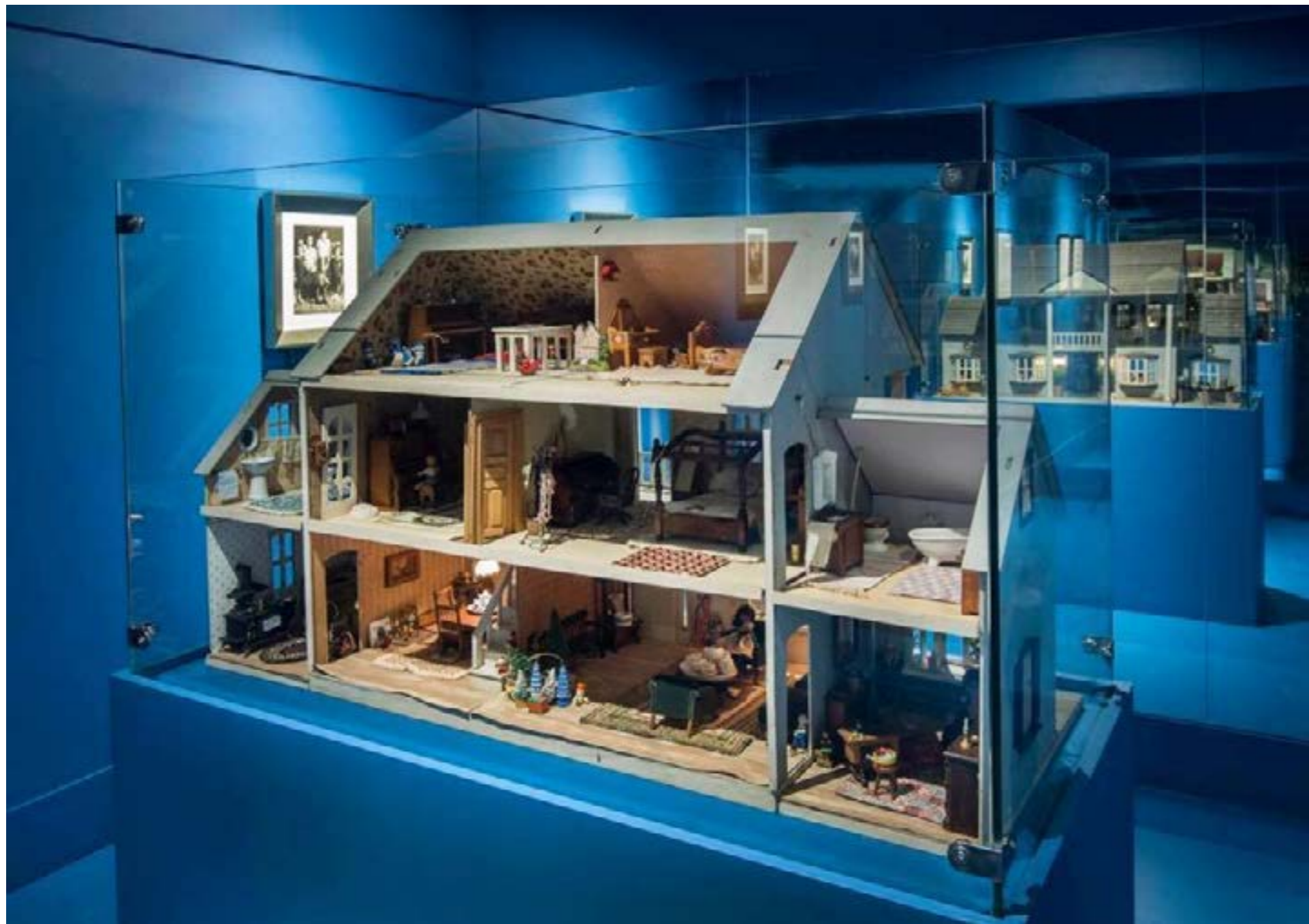
Fig. 6: Instalação Casa de boneca, 2017.

dão indícios de como o espaço interno é marcado por vida - tem alma. Assim, a artista se une às condições experienciais e se coloca a conversar com o Tempo.