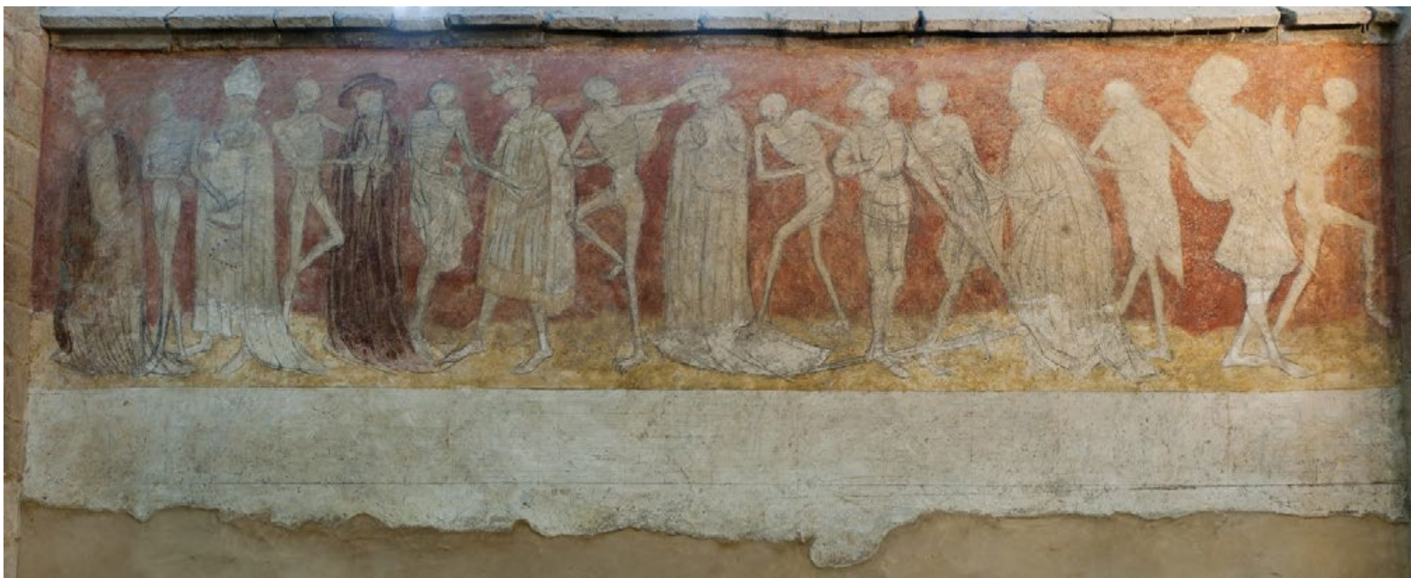
Fig. 2: Abadia de la Chaise-Dieu, Dança macabra , circa 1460. Afresco.

pragas e as guerras (Guerra dos Cem Anos) dizimaram a população europeia, que acreditamos ter sido reduzida à metade entre 1350 e 1450. A Igreja fez da preparação para a morte um tema muito importante para reflexão, e usou a imagem como uma aliada. A arte deste período carrega esta marca. No