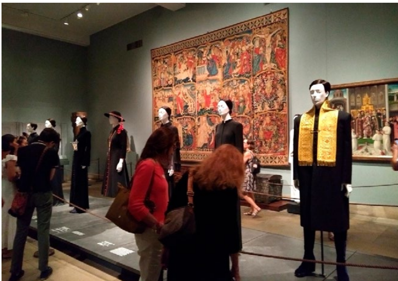
Fig. 5: Exposição Heavenly Bodies: Fashion and the Catholic Imagination , 2018. Metropolitan Museum, Nova Iorque.

A mostra conjugava artes visuais, música e moda, além de propor outro olhar para a coleção permanente do museu. Foi tocante andar por entre obras e roupas que evocavam outros