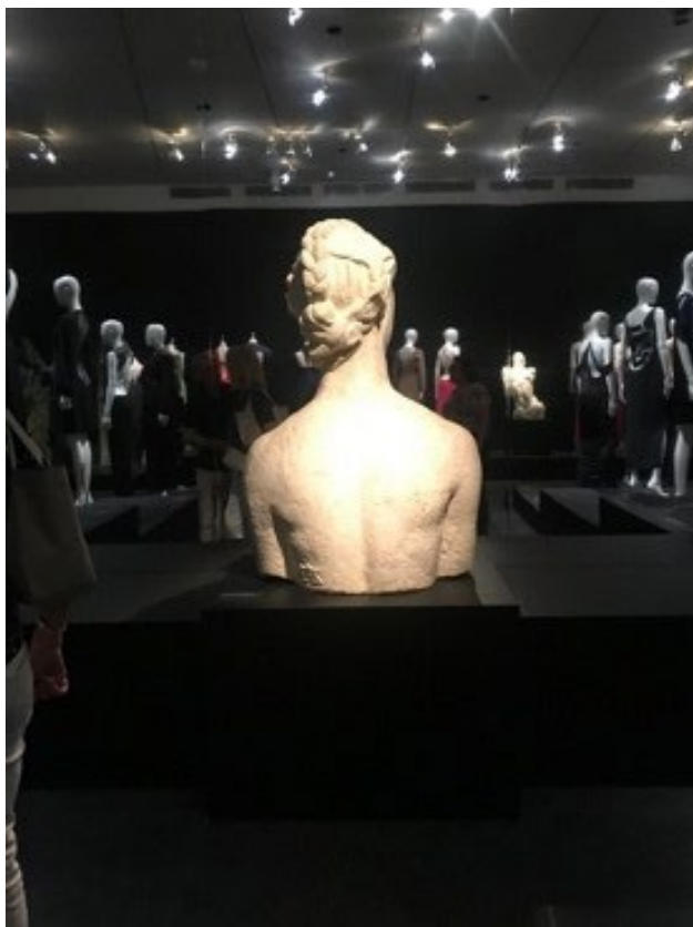
Fig. 4: Dorsos, exposição Back Side/Dos à la mode , 2019. Fonte: OLIVEIRA e JORDANI. Intertextualidades Visuais . SC: Estação das letras e cores, 2021. P. 220.

as imagens de moda como vertente imagética que conduz a exposição em diálogo com o Dorso de Bourdelle, enfatizando as curvas, sensualidade das linhas, assim como os negros e brancos que davam dramaticidade ao conjunto.