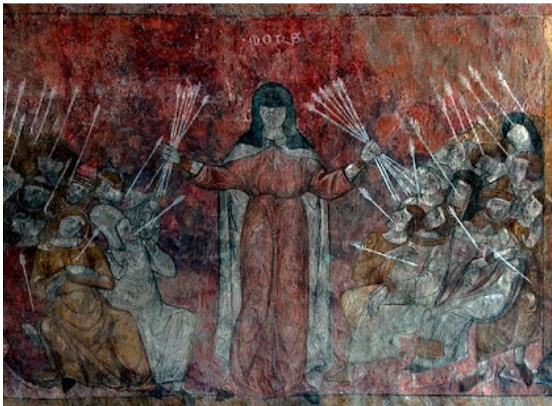
Fig. 1: Afresco na Abadia de Saint-André-de-Lavaudieu, França, século XIV.

em uma coletânea que reúne artigos escritos e/ou publicados de 2015 a 2020, dispersos em anais de congressos ou revistas científicas, textos nem sempre acessíveis a professores, historiadores e teóricos de arte, designers, fotógrafos,