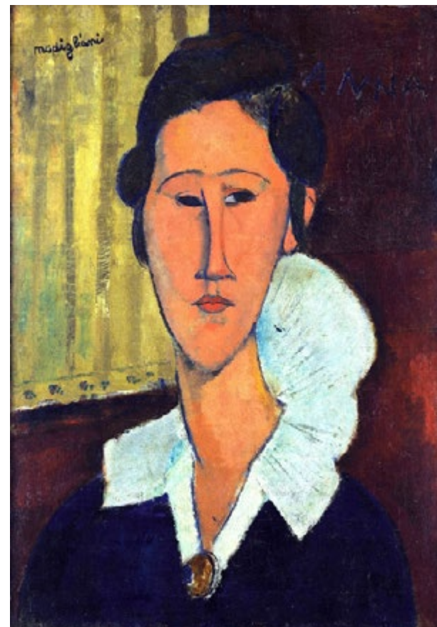
Fig. 6: Escudo Azande, 1883, e Amedeo Modigliani, Ritratto di Hanka Zborowska , 1917.

Os diálogos temporais também se apresentam no capítulo 12, onde o texto propõe uma análise de uma mostra do acervo da GNAM, Galleria Nazionale di Arte Moderna , Roma, 2019, onde o